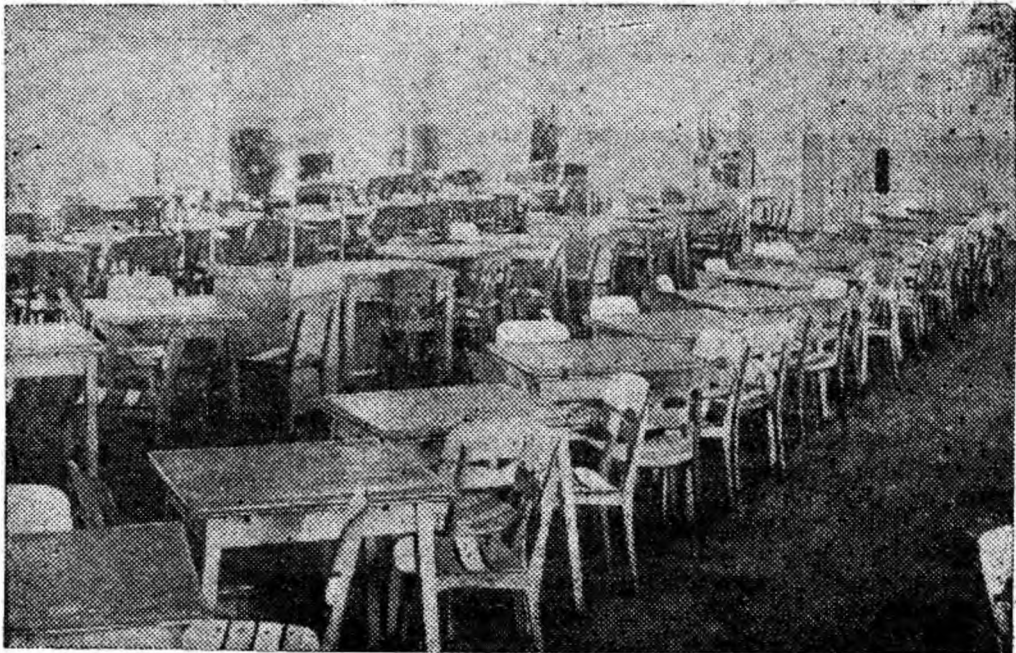
În sala de mese a cantinei Grupului școlar profesional din Lupeni.