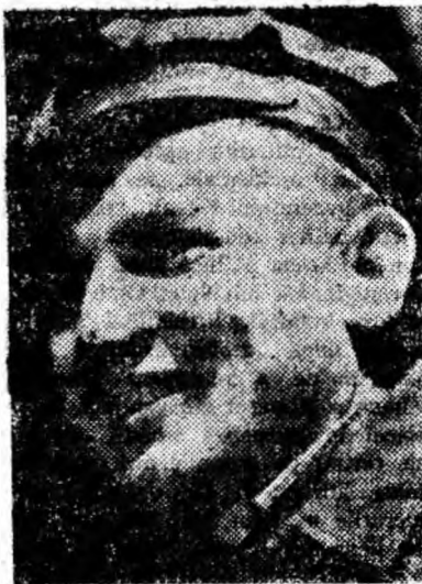
Brigadierul Jurj Gheorghe.

tuși colectivul condus de Jurj de celelalte brigăzi din sector?