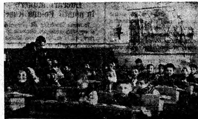
Oră de compunere la școala nouă de 4 ani din Slătînoara.