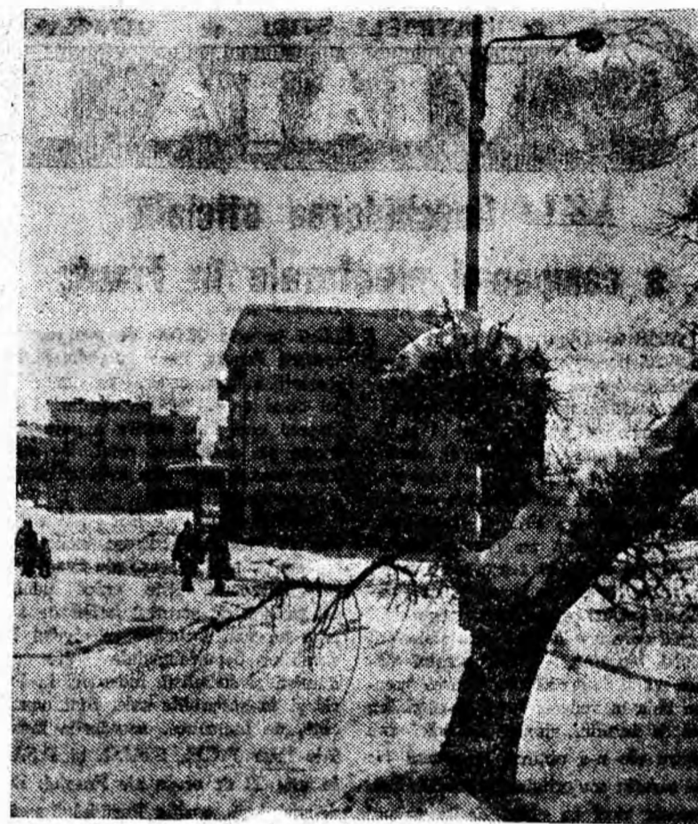
larna în cartierul nou.

Colectivul de muncitori, tehnicieni și ingineri ai întreprinderii noastre va depune toate străduințele spre a asigura terminarea la timp și de bună calitate a construcțiilor industriale necesare exploatarea carboniferă, sprijinindu-le astfel în sporirea producției de cărbune.