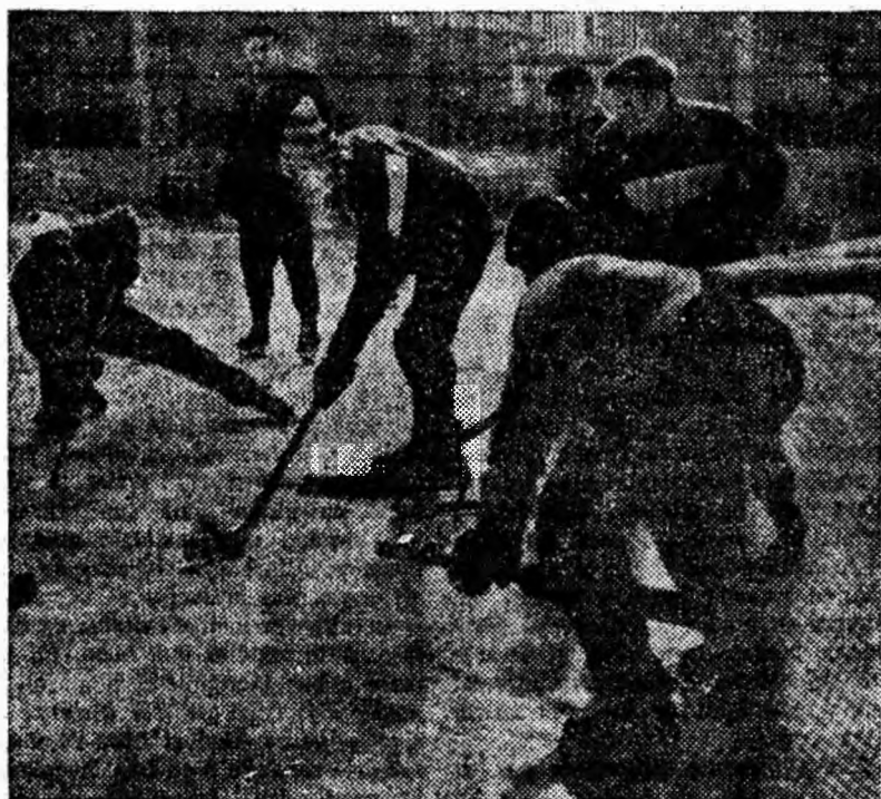
La hochei, acțiunile de atac la poartă sînt deosebit de spectaculoase. Peza din clipeu este semnificativă în acest sens.