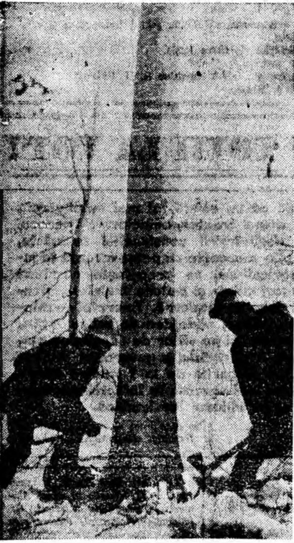
Fierăstrăul mecanic a intrat în funcțiune. În curînd, tăgutul se va prăvăli pe costișă.

fectuate cu mijloace mecanizate la 34 000 metri cubi de material lemnos. În 1964, cifra s-a ridicat la 188 000 metri cubi, iar în 1965 la 240 000 metri cubi. • La scos-apropiat, producția pe bază mecanizată a crescut în 1964 la 150 000 metri cubi, față de 68 000 cît era în 1959. În 1965 mecanizarea la aceste operații va crește la 158 400 metri cubi. • Suprafața locuibilă în cabane a crescut, de asemenea, substanțial. De la 2600 metri pătrați cît era în 1960 ea va fi în acest an de 5750 metri pătrați.