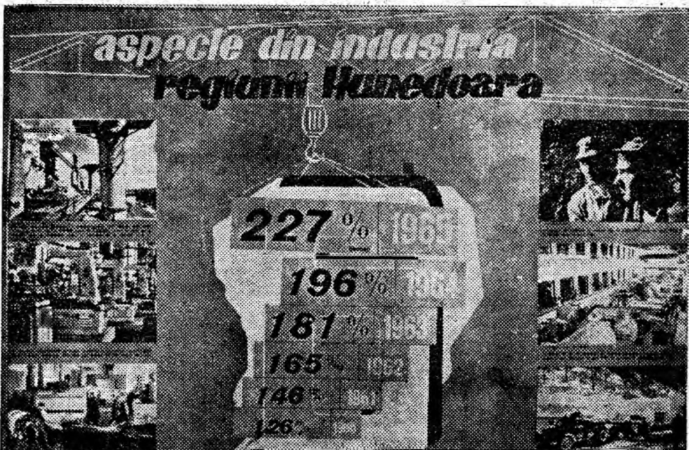
Dinamica creșterii producției industriale globale față de anul 1959.