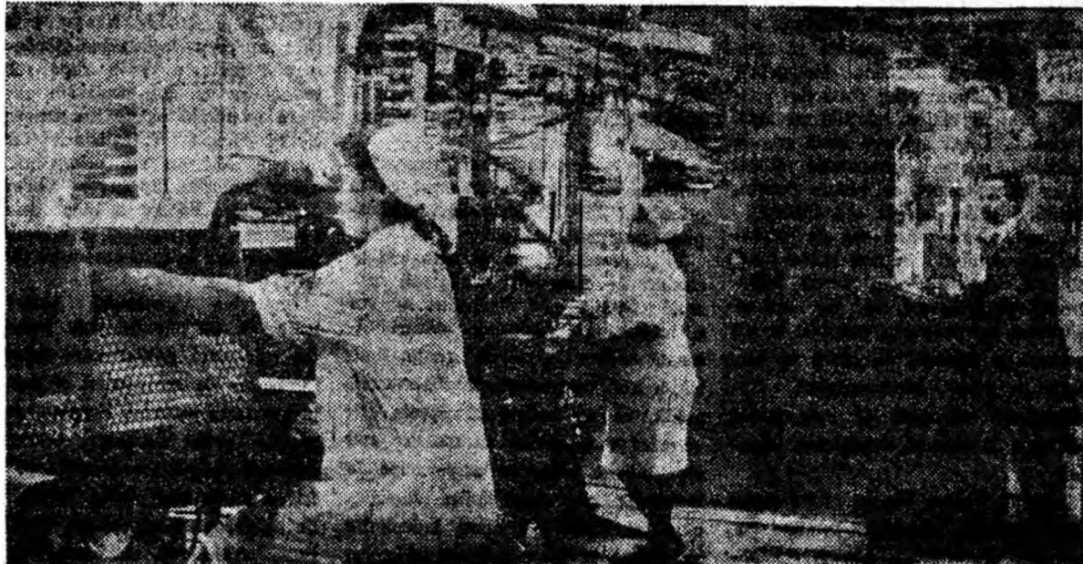
În fotografia de mai jos: Linia automată de fabricat tuburi din aluminiu pentru pastă de dinți și cremă de față din cadrul fabricii Nivea din Brașov, unde marea majoritate a muncitorilor sînt femei.

Pînă în prezent au fost rezolvate mai bine de 60 propuneri.