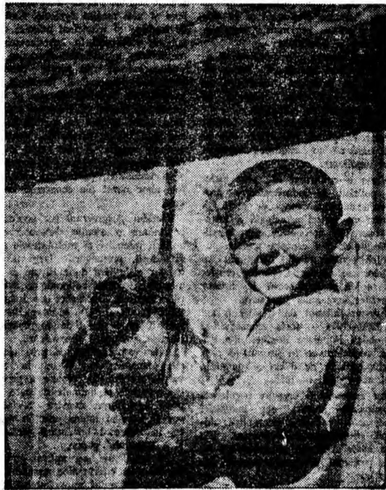
Semne de primăvară...

— Fără îndoială, dragă primăvară, fii convinsă că deși mi-ai spus doar mie toate acestea vei fi auzită. Duminică, în ziua alegerilor orașul nostru se va prezenta la înălțime, așa cum se cuvine unui oraș al minerilor GH. RUDOLF