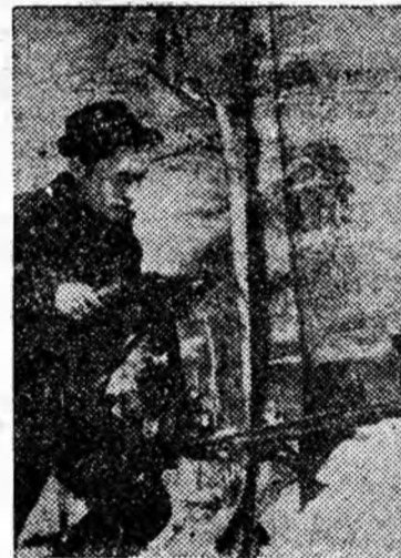
Drujbistul Leordean Vasile din sectorul forestier Bilugu II în plină activitate.

Pentru dezvoltarea succeselor obținute, pentru înăfăptuirea mărețelor perspective pe care ni le înfățișează partidul, să dăm din toată inima votul nostru candidaților F.D.P. în alegerile de la 7 martie!