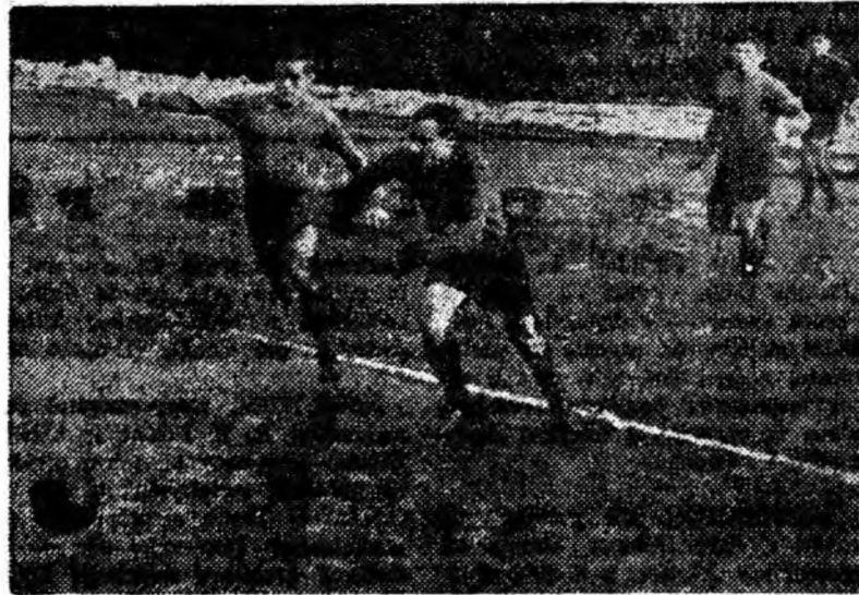
Atacantul Precup de la Minerul Lupeni a intrat în careu. Un șut plasat dintr-un unghi dificil și golul s-a marcat! Fază din întîlnirea Minerul Lupeni — Crișul Oradea.