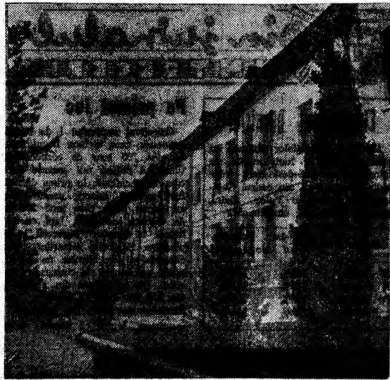
Vedere exterioară a clădirii I.M.P.

În cadrul pregătirilor în vederea reluării campionatelor republicane și regionale, echipele de fotbal, volei, handbal și rugby au efectuat mai multe meciuri de verificare. Tot în acest scop, echipa de rugby va susține la București, la sfîrșitul acestei săptămîni, întâlniri în cadrul „Cupei 6 Martie” cu echipele Dinamo și Grivița Roșie. Echipa de handbal se deplasează la Brașov, unde va susține meciuri cu echipele Dinamo, Tractorul și Știința, iar echipa de volei se deplasează la Alba Iulia, unde se va întâlni cu echipele Știința Brașov, Industria Sîrmei Cîmpia Turzii și Știința Alba Iulia.