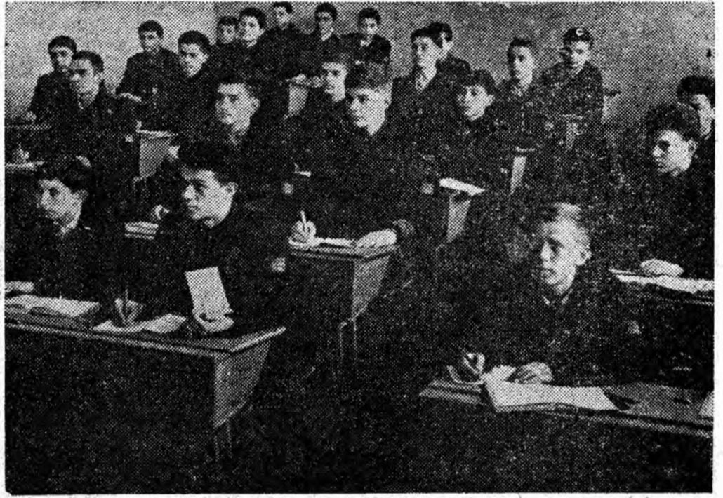
Oră de matematică la Școala profesională din Lupeni. Elevii ascultă cu atenție explicațiile profesorului care le dezvoltă noii „taine” ale acestei științe atât de importante pentru activitatea contemporană.