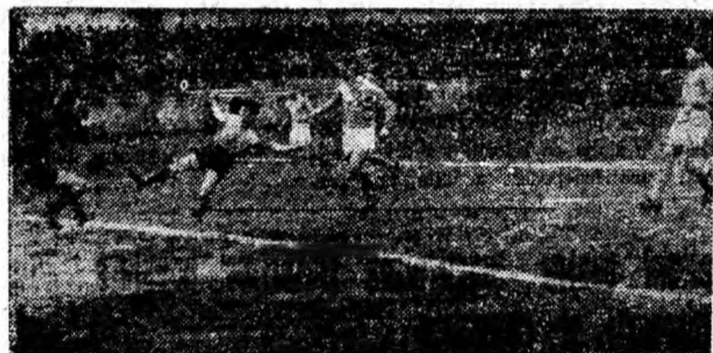
Ținînd printre apărători, Pleianu înscrie primul gol al minerilor pe lângă portarul înșit în întîmpinare.