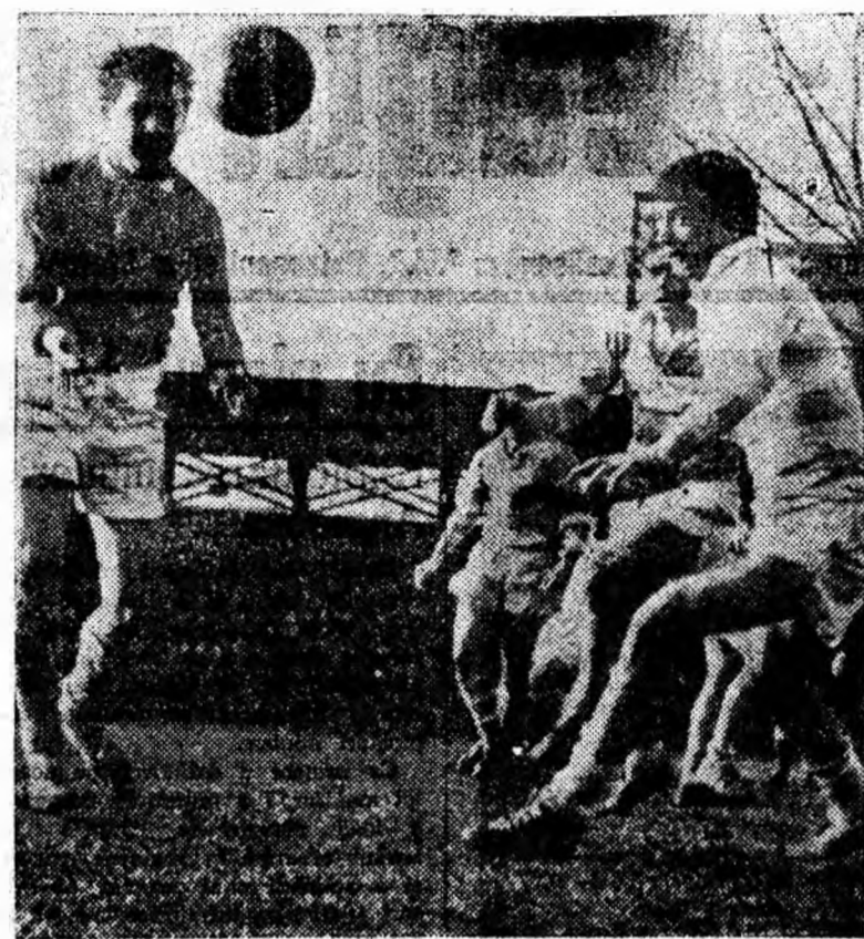
Fază din întâlnirea de rugbi Știința Petroșani — Știința Cluj.