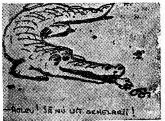
ROLEU! SĂ NU UIT OCHELARI!