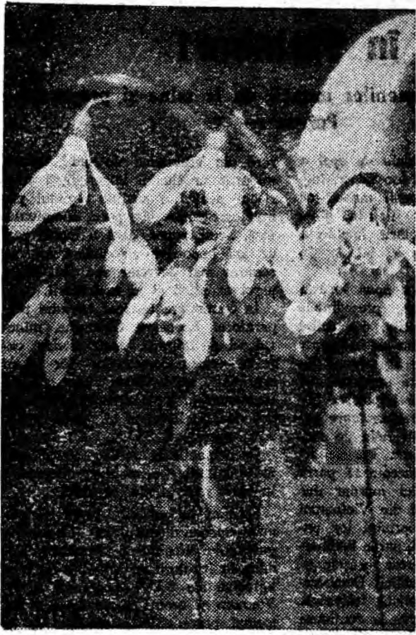
Ghiocii s-au ivit gingași de sub zăpadă. E primul dar al primăverii.