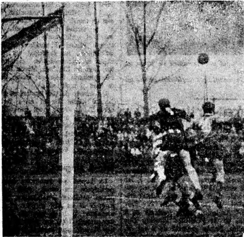
Atac la poarta Jiului.