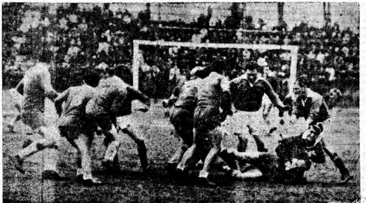
© fază din întâlnirea de rugby (Lupeni).