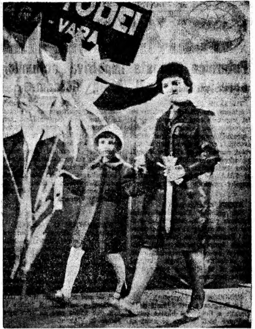
După cum s-a mai anunțat, duminică a avut loc la Petroșani o reușită consfătuire cu populația, organizată de cooperativa de producție meșteșugărească „Jiu” în colaborare cu O.C.L. Produse Industriale. Consfătuirea a fost urmată de o plăcută surpriză pentru participanți: prezentarea diferitelor modele (aspect în clișeu) de îmbrăcăminte de femei, bărbați și copii — la modă în sezonul de primăvară și vară din anul acesta.