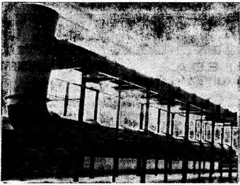
Laboratorul de aeraj de la Stația de cercetări pentru securitate minieră din Petroșani. Fotografia reprezintă modelul aerodinamic pentru determinarea coeficientului de rezistență a lucrărilor miniere.