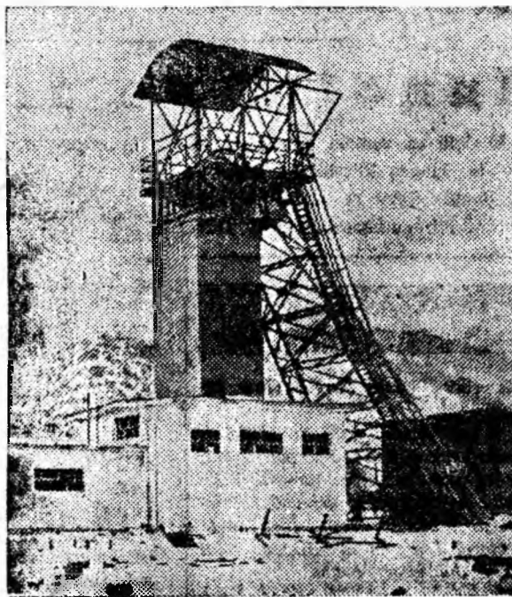
Unul din noile puțuri de la mina Urlicani.