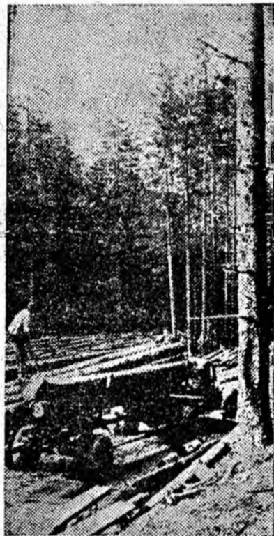
30 000 mc lemn de brad de bună calitate așteaptă să fie transportat din exploatarea forestieră „Cibanu” din Jieț.

ÎN CLIȘEU: O mașină autoîncărcătoare încarcă mecanic un nou transport de lemn pe care-l va aduce jos la gară pentru expediere.