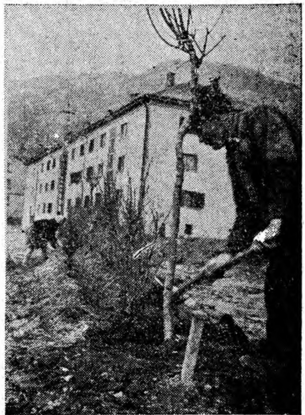
Mai spații verzi iau naștere în jurul blocurilor.

Iată decorul nou creat de oameni harnici, buni gospodari în care localitățile Văii Jiului așteaptă sosirea zilei de 1 Mai.