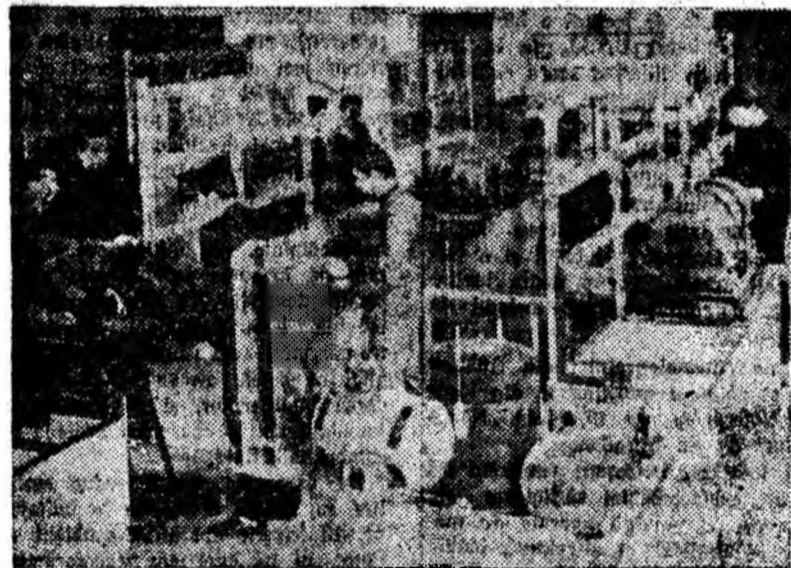
Studenți la lucrările practice de laborator. CLIȘEUL DE SUS: în laboratorul de Rezistența materialelor. CLIȘEUL DE JOS: în laboratorul de mașini electrice.