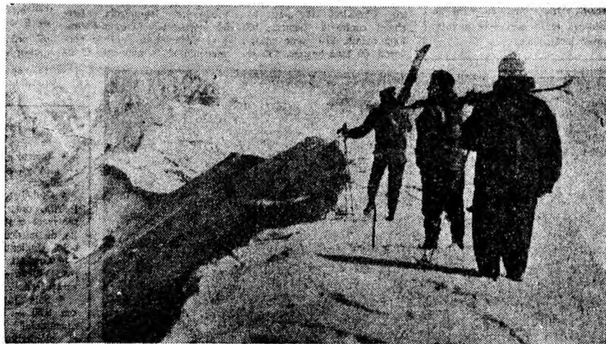
Dață în aceste zile de primăvară tăpșanele de la poala Parîngului atrag numeroși oameni ai muncii, dornici de a petrece cîteva ore plăcute la iarba verde, culmiile sale cu zăpadă nu duc nici ele lipsă de vizitatori. În clișeu: Vedere de pe Parîng.

aiabă liniște, ele cer și în prezent să înceteze zgomotele nocturne de la parter. Rezolvarea e simplă. Se cere doar a fi luate cîteva măsuri corespunzătoare din partea celor competenți.