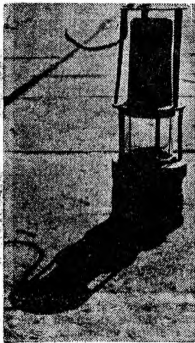
Călușă și prietena minerului.