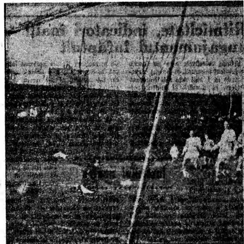
Așa s-a marcat primul gol al partidei Jiul Petrița — A. S. Cugir.

cu multe faze palpitate, dar și cu... multe ocazii de gol ratate.