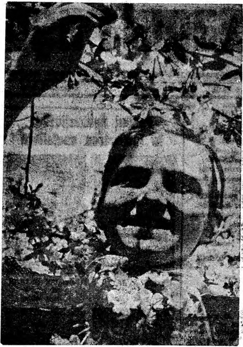
Prospețime. Flori și copilărie fericită.

Ajături de întregul nostru popor, oamenii muncii din Valea Jiului au întâmpinat în acest an ziua de 1 Mai — ziua frăției muncitorilor de pretutindeni — sub semnul desfășurării unei susținute munci pentru a contribui la dezvoltarea economiei noastre naționale, la continua înflorire a patriei socialiste.