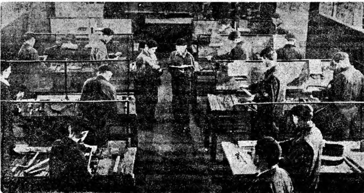
Se pregătește schimbul de mâine. La o oră de curs în atelierul de lucrări practice al Școlii profesionale din Lupeni.