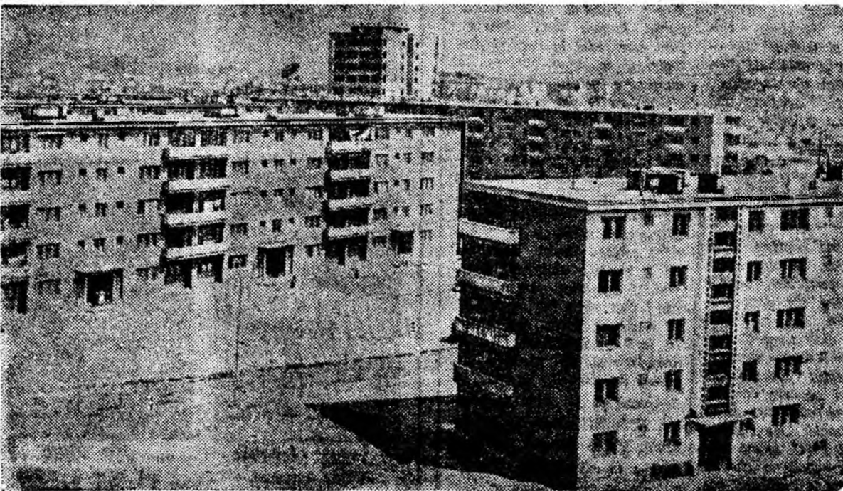
Petrila. Cartierul nou.

Sala de sport a I.M.P., ora 9,30 — campionat categoria A, seria II-a, la volei: Știința Poroșeni — Știința Brașov.