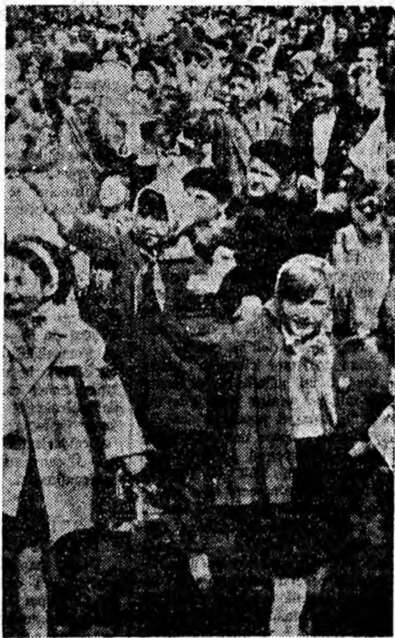
Demonstrează pionierii pentru copilăria lor fericită, pentru viitorul ce-i cheamă spre ei.

Demonstrează cu bucurie și entuziasm florile vieții noastre libere, viitorul de mîine al patriei socialiste. Și în pașii lor energici răsună parcă mîndria de a fi școlar, hotărîrea de a învăța mai mult și mai bine.