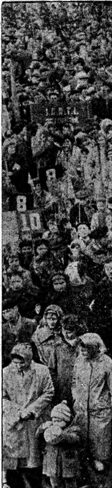
În piața Victoriei la mitingul de 1 Mai.

„Steagul roșu de întreprindere fruntașă în întrecere pe anul 1964” este purtat cu mîndrie de mînerii aninoseni — cu hotărârea de a obține noi succese.