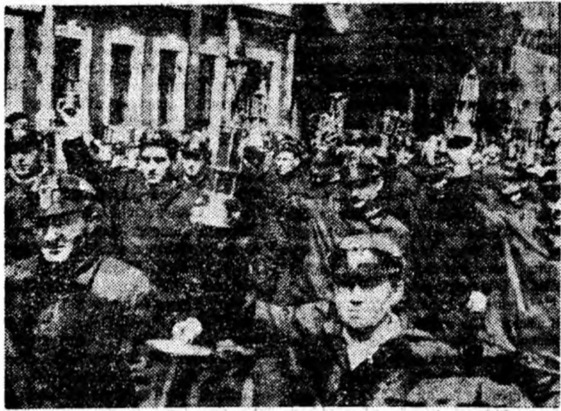
Un grup de oameni în salopete albastre, viguroși și entuziaști — minerii Lupeniului.

Cu toții demonstrează pentru viața noastră nouă, pentru pace, pentru viitorul de aur al patriei.