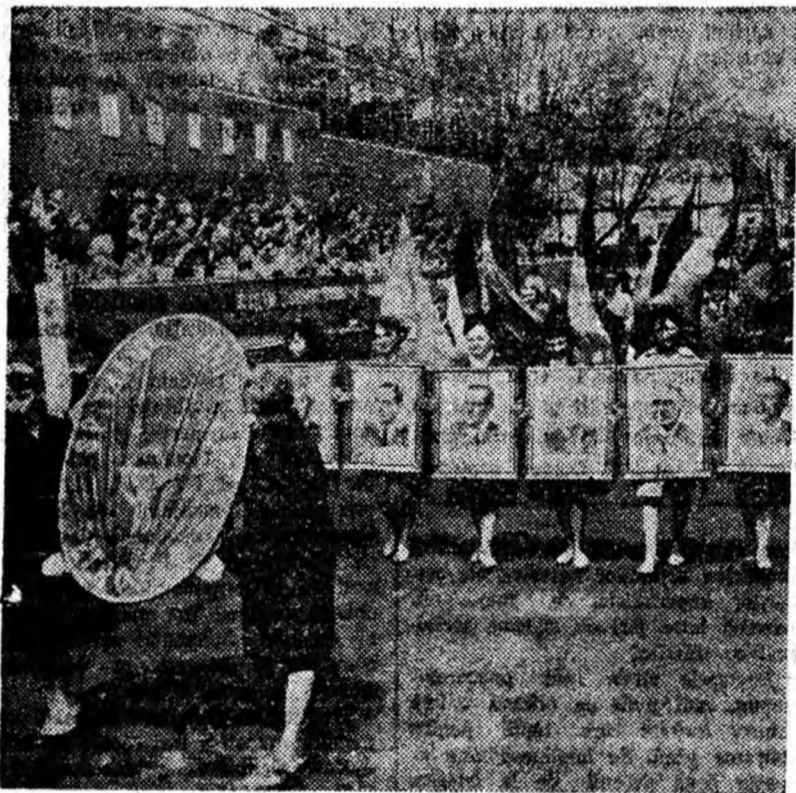
Prin fața tribunei trec lucrătorii unităților sanitare din Petroșani.

Voleibaliștii de la Știința Petroșani au adus o nouă satisfacție sporturilor lor învingînd pe colegii lor din Brașov cu scorul de 3—0. Partida a fost în general la discreția studenților din Petroșani.