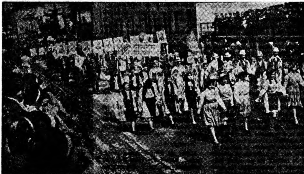
La braț cu muzica și dansul, trec prin fața tribunei artiștii amatori.

Constructorii de locuințe și de obiective industriale din Valea Jiului demonstrează cu hotărîrea de a transforma fața localităților Văii într-un colț mereu înfloritor al patriei.