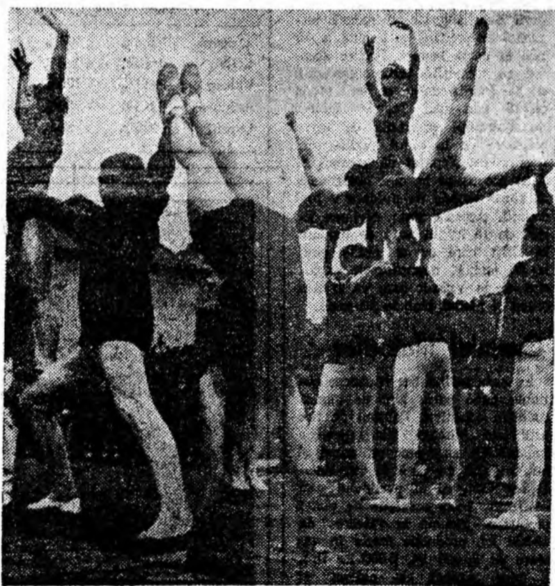
Gimnaștii își demonstrează măiestria.