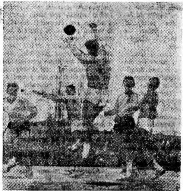
În clișeu: O fază din meci.