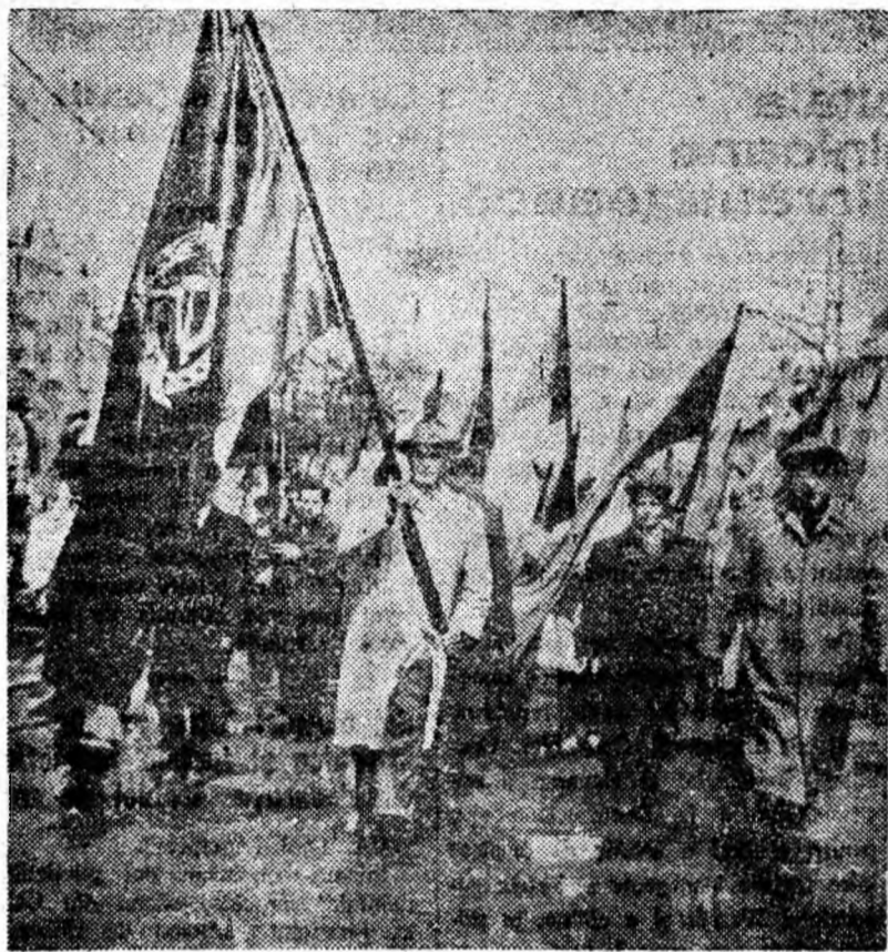
Coloana metalurgiștilor de la U.R.U.M.P. în fața tribunei.