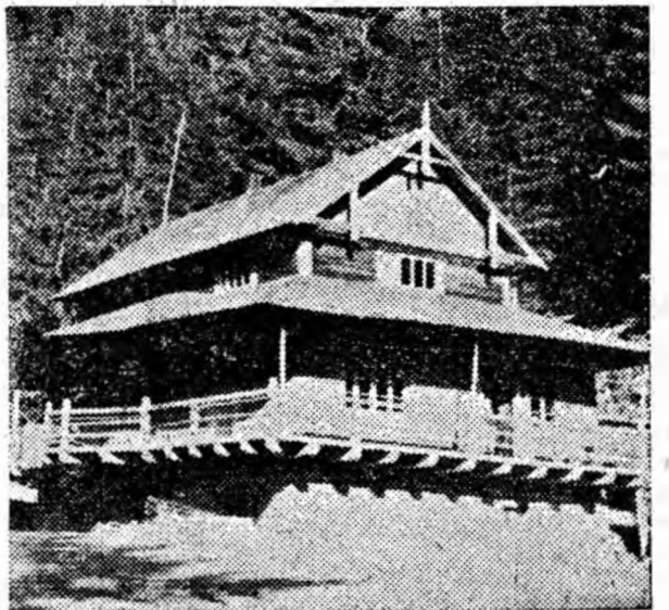
In fotografie: Cabana Jief.

Folosirea din plin a inzestrării tehnico-materiale și a rezervelor înterne, concentrarea atenției colectivului spre rezolvarea problemelor principale ale activității de exploatare a materialului lemnos, desfășurarea largă a întrecerii socialiste vor aduce forestierilor din Valea Jiului noi succese în muncă, cu care vor cinsti Congresul partidului, măreț eveniment în viața noastră.