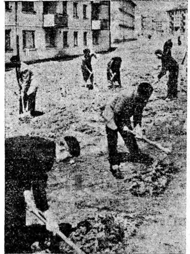
Pe viitoarele zone verzi din jurul blocurilor.