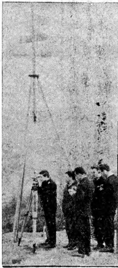
Studentii din anul IV topografie de la Institutul de mine Petroșani la o oră de aplicații practice.

O adunare festivă asemănătoare s-a organizat și la Școala medie din localitate.