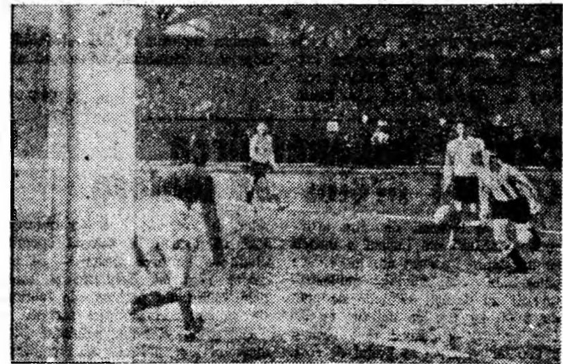
Alec la poarta echipei Sătmăreana, ratat de Casandra.

cul, altădată — punctul neuralgic al echipei — s-a descurcat mai bine, a combinat subtil și... a reușit să și înscrie cinci goluri. Dacă prima repriză, putem spune că ne-a aparținut în întregime, în cea de-a doua, jocul a fost mai echilibrat. Asta datorită și faptului că jucătorii noștri n-au mai insistat cu atita vigoare ca la început, mulțumindu-se cu „zestrea” de goluri înscrise în prima parte. De la noi mi-a plăcut în mod deosebit Farkas (în revenire de formă), Casandra, Martinovici, Pop și Șerban. Oaspeții au jucat tot timpul deschis, au făcut un joc, în general frumos în timp, dar ineficace în fața porții”.