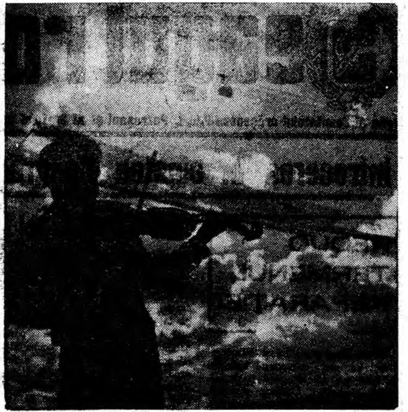
Primăvara în cînt de funicular și... vioară.