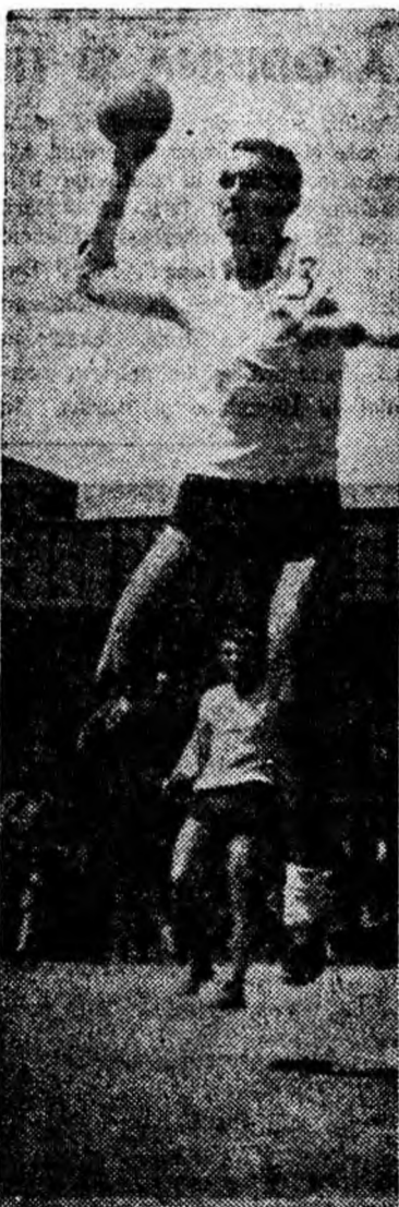
O săritură, un șut, și scorul se mărește în favoarea studenților.