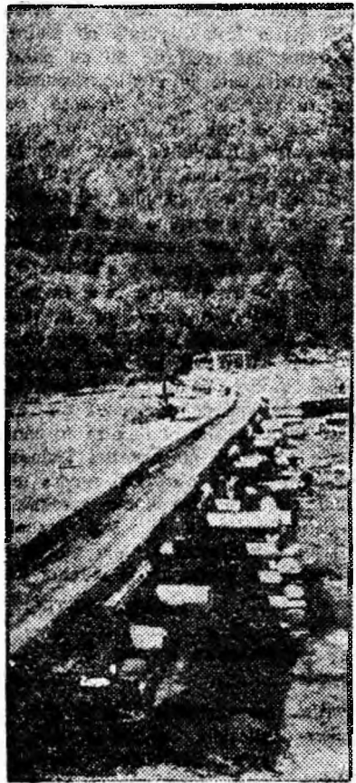
Sub scoac — unul din sutele de colțuri pitorești din împrejurimile Văii Jiului.

Drumul pînă la virful cel mai înalt al munților Parîng s-a dovedit a fi mai greu decît ni-l închipuisem. În să nimeni n-a regretat: am trecut printr-o pădure cu copaci seculari doborîți de furtună; am pășit pe margini de prăpăstii ale căror a-dîncuri ne strecurase în inimă fiorul