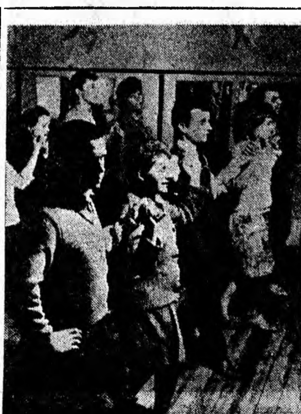
Formația de dansuri a clubului muncitoresc din Petrița la o repetiție.

Teatrul de Stat Petroșani va fi prezent cu „Ciadela stîrnită“ de Horia Lovinescu.