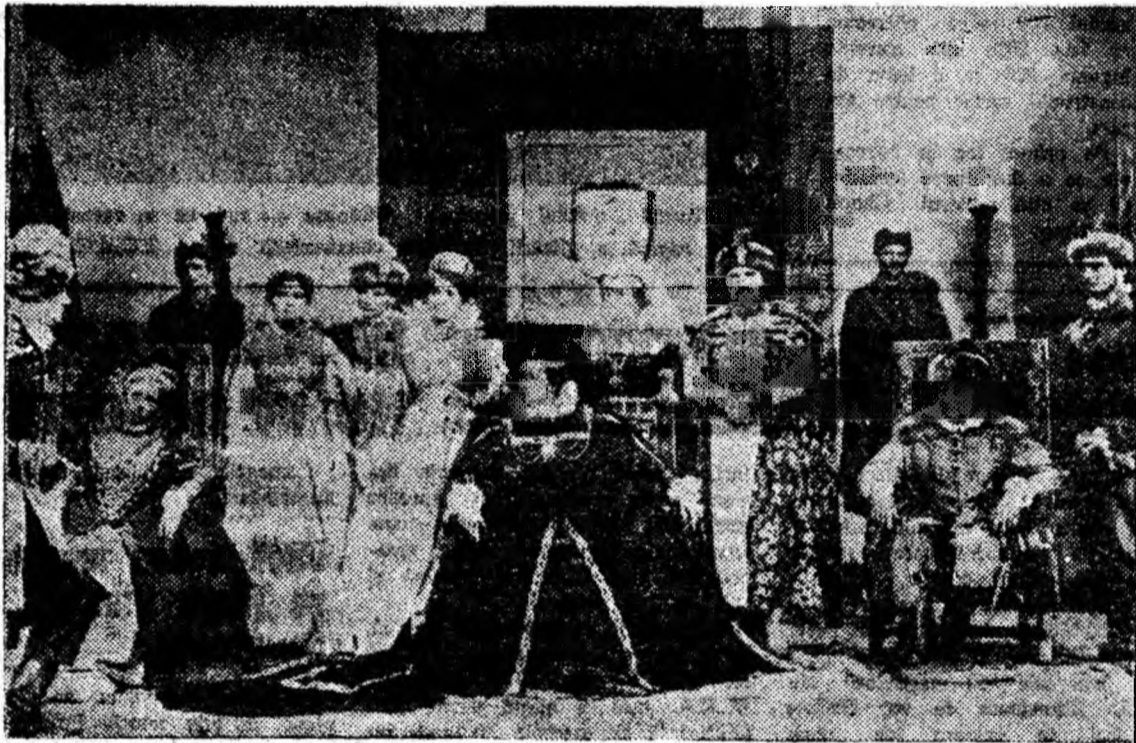
O secvență din film.

Acesta este al doilea premiu obținut de filmul „Pădurea spinzuraților“, după „Premiul de excelență“ la al IV-lea concurs tehnic internațional al filmului de la Milano din anul 1964.