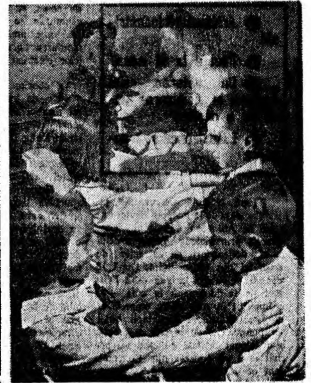
Pregătiri pentru serbare.