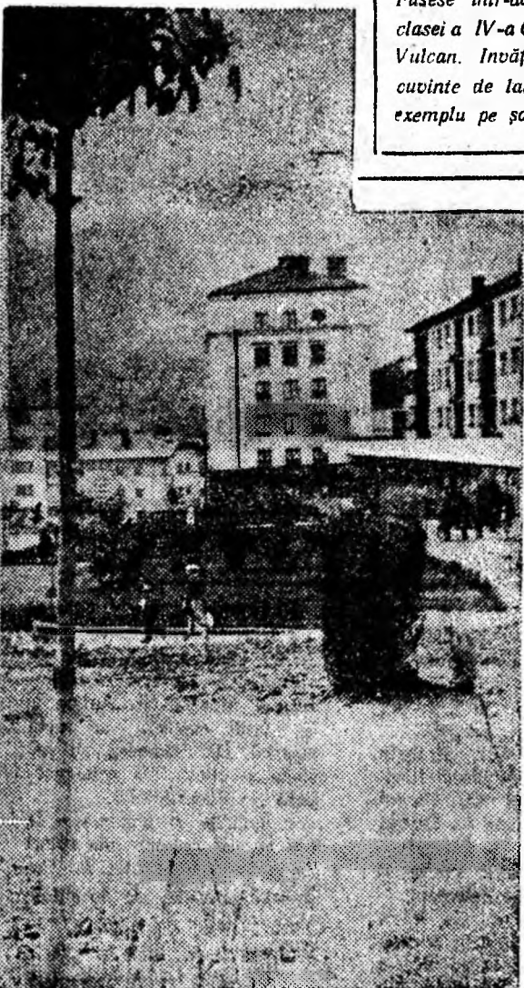
Ținerețea orașului Lupeni. Vedere din cartierul nou — Viscoza.