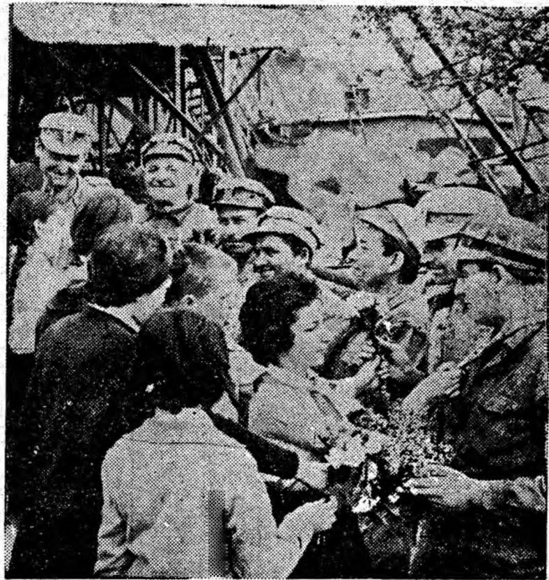
La întîlnirea cu pionierii.