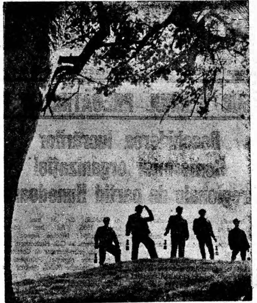
După orele petrecute în adînc, lumina soarelui, frunzele de un verde crud și iarba pe care pășești sînt deosebit de impresionante.