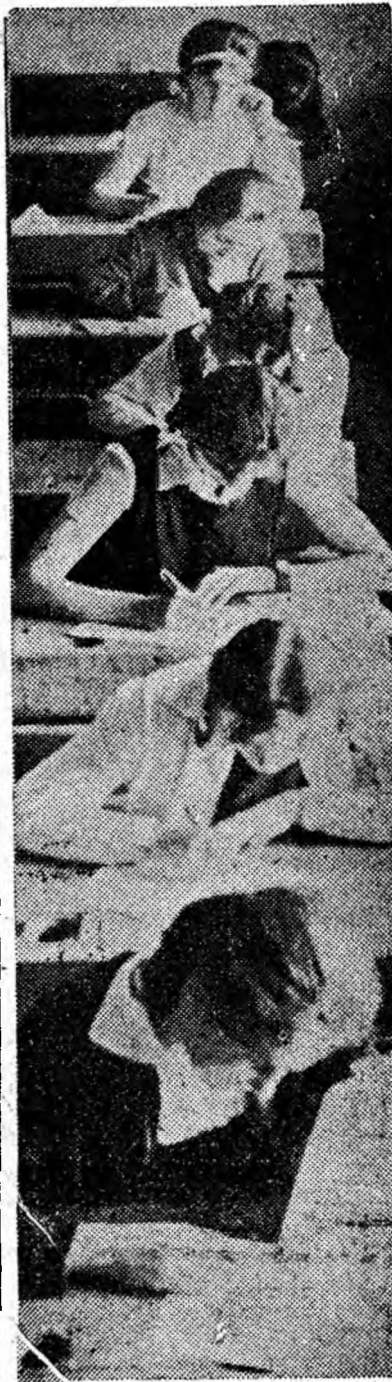
Aspect din prima zi a examenului de maturitate. Se dă proba scrisă la limba română. Atenție, concentrare și lucrarea va izbucni. Apoi două zile pauză și miine, la ora 9, iarăși în bănci pentru lucrarea scrisă la matematică.

◆ Azi, ora 19,30, în sala Teatrului de Stat din Petroșani Școala populară de artă din localitate prezintă un program artistic intitulat „Cine știe... spune tot”.