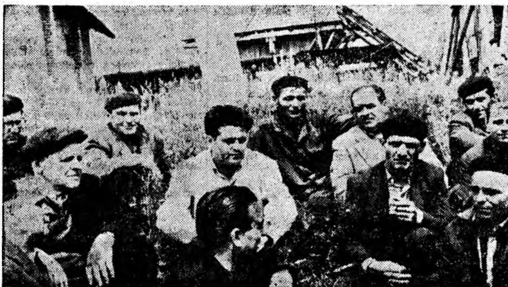
Un scurt moment de odihnă în iarba moale este folosit pentru exprimarea primelor constatări; se pun întrebări, se fac comparații...