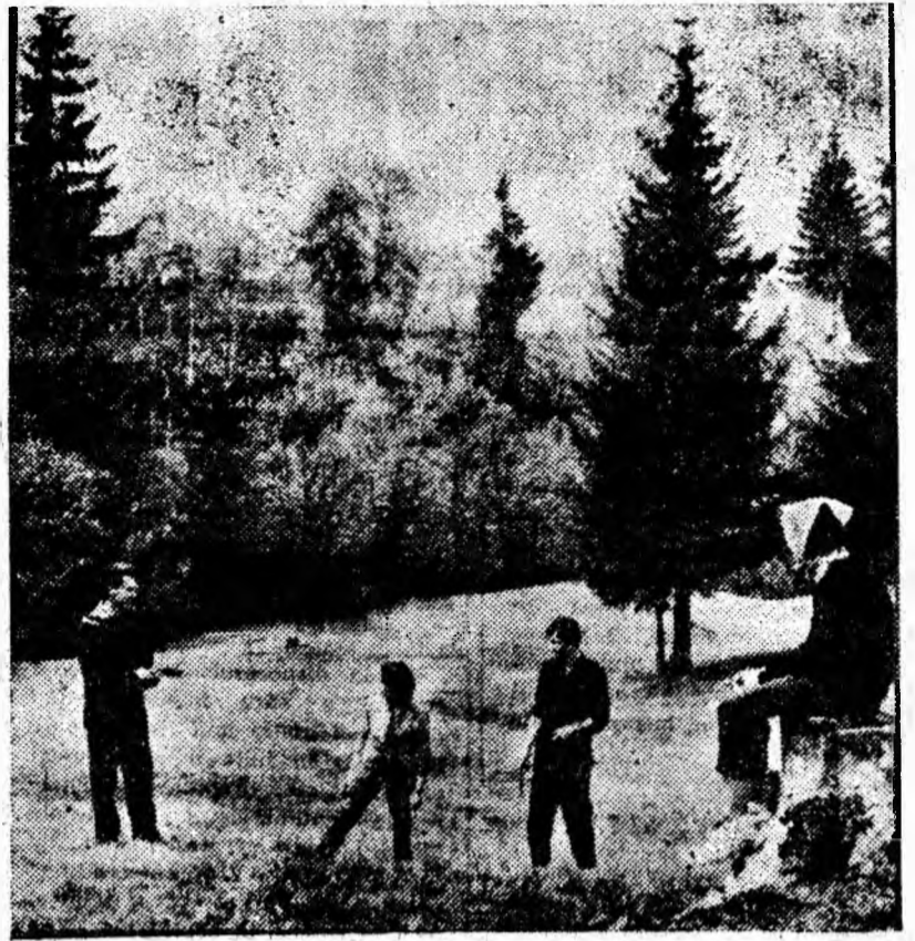
Aerul ozonat al munților cheamă, la flecare slrșit de săptămîna, mi de oameni ai muncii la drumeție. Și duminică munții ce inconjoară Valea Jiului au fost luați cu „asalt”. Antrenul sporește pofta de mișcare. Și atunci o tolosești la jocuri în aer liber (ca în fotografia de mai sus).

Fotbalul românesc a călcat cu dreptul în... preliminariile campionatului mondial, stîrnind interesul și comentariile favorabile ale cercurilor fotbalistice internaționale în jurul echipei naționale a României. Mai întii un scor net (3-0) cu Turcia, apoi o nouă victorie, de data aceasta la limită (1-0), dar asupra vice-campioanei mondiale din Chile, Cehoslovacia. În sfîrșit, un onorabil 1—2 la Lisabona, în compania Portugaliei, una din cele mai bune reprezentative din Europa.