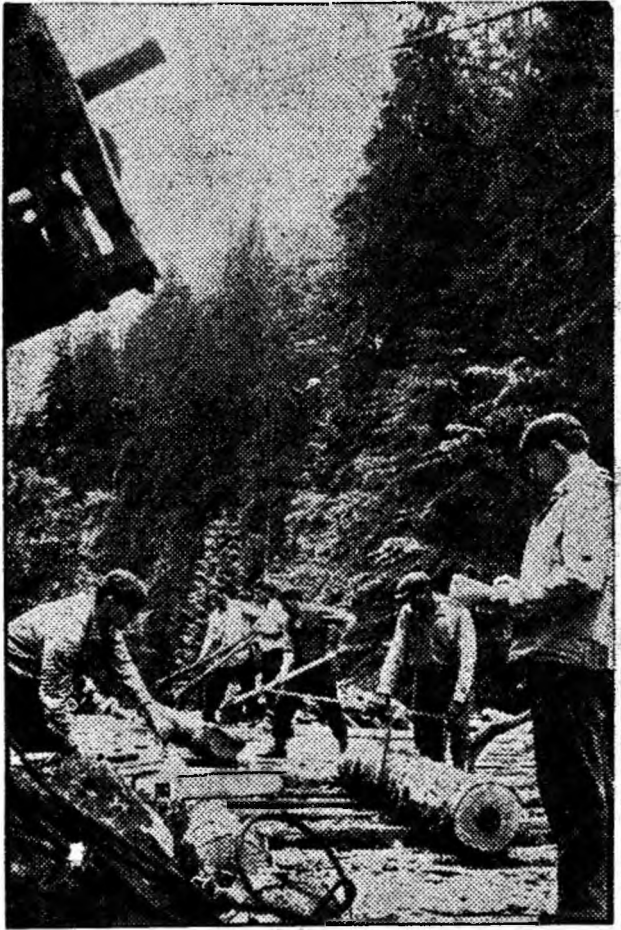
La rampa exploatării forestiere Cîmpușel — sectorul Cîmpu lui Neag — se încarcă zilnic zeci de metri cubi bușteni de fag. Iată, pregătirea unui nou transport pentru autocamioanele forestiere.