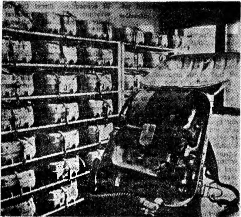
Ca și celelalte exploatare din bazinul Văii Jiului, mina Lupeni a fost dotată cu valoroase mijloace de protecție a muncii. Dintre acestea, o mare importanță prezintă și aparatele de salvare de tip M.E.D.I. (în alizeu).

nului de măsuri cu privire la respectarea N.T.S., a reieșit faptul că organele și organizațiile de partid de la exploatarea miniere s-au preocupat cu răspundere de îndeplinirea prevederilor cuprinse în aceste planuri. La mina Petrița, comitetul de partid a format colective din activul de partid care au studiat în sectoarele minei problemele privind îmbunătățirea aerajului, aprovizionarea brigăzilor. Comitetele de partid de la minele Vulcan și Aninoasa au întreprins, de asemenea, acțiuni în sprijinul îndeplinirii planului de măsuri. În drumurile de comitetele de partid, organizațiile de bază au desfășurat o activitate susținută în sprijinul îmbunătățirii protecției muncii și întăririi disciplinei în producție. Aceste probleme au fost analizate în adunările generale ale organizațiilor de bază din diferite sectoare ale minelor Vulcan, Aninoasa, Lupeni, Uricani, Petrița. Acțiunile întreprinse au drept rezultat formarea unei opinii combative împotriva abaterilor de la N.T.S.