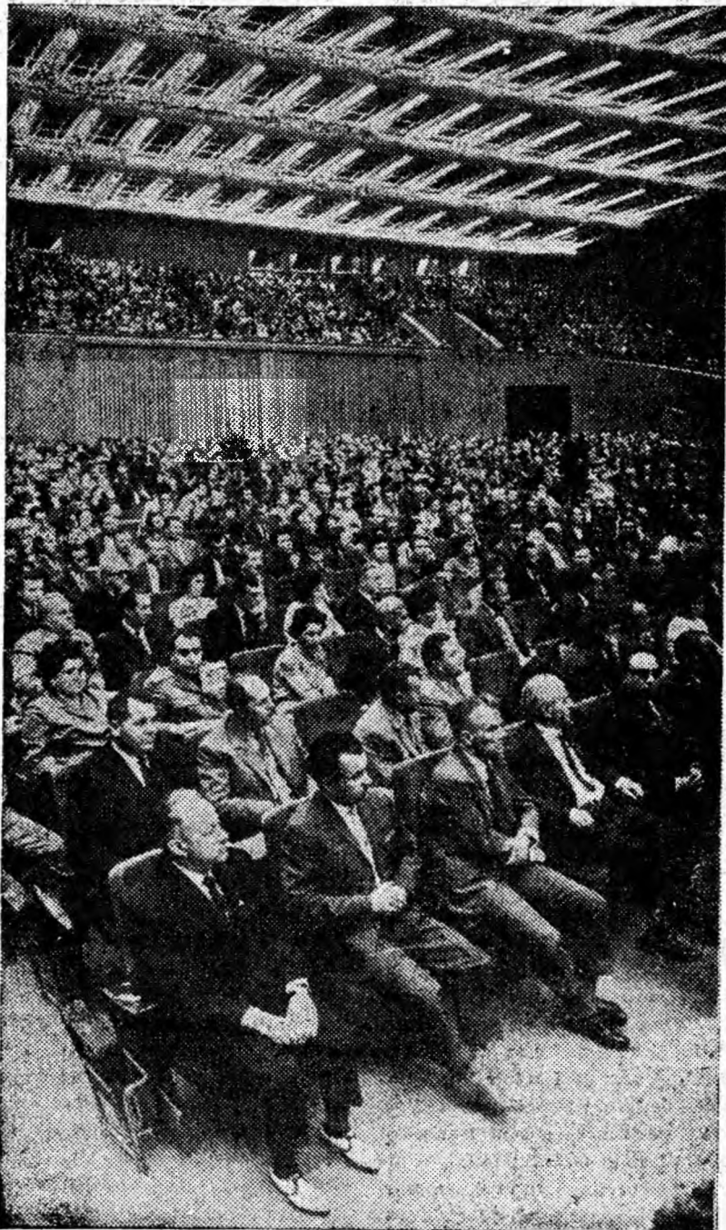
Aspect din sala Congresului.