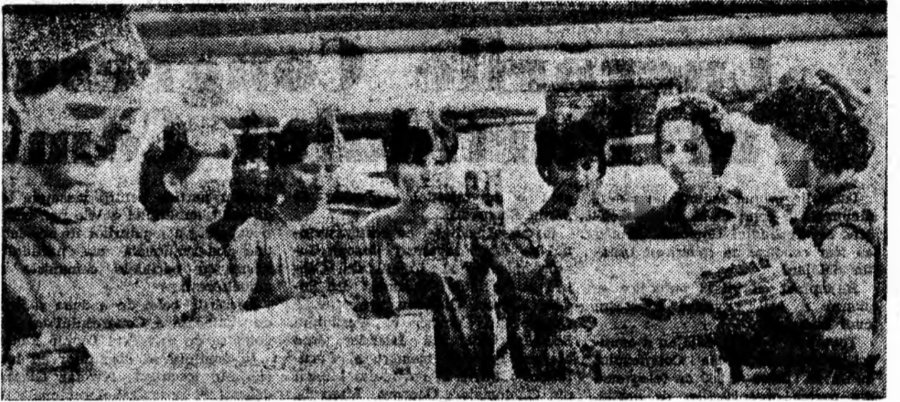
F.F.A. „Viscoza” Lupeni. Animație mare în secția a III-a a fabricii: au sosit ziarele cu vești despre lucrările Congresului.