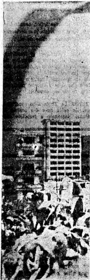
Flori și blocuri încîntătoare în orașul Petrila.

◆ Terenul de volei Aninoasa, ora 11 — finala Spartachiadei de vară, faza orășenească.