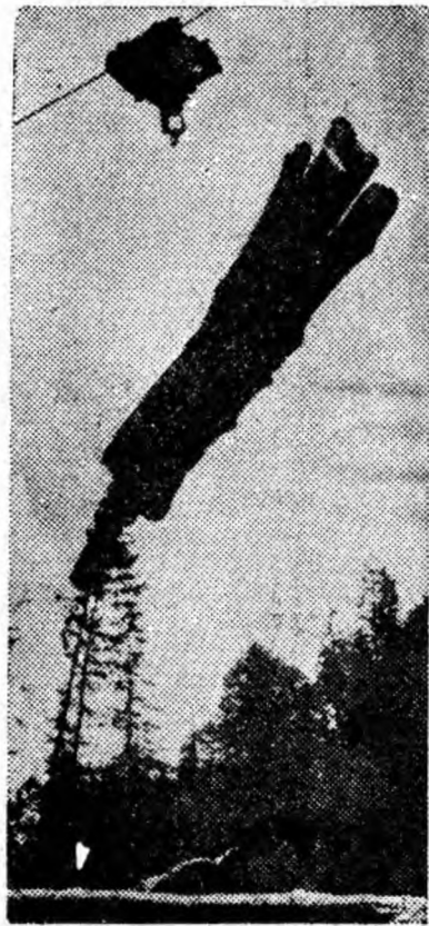
La exploatarea forestieră Valea Boului de la Cîmpu lui Neag, funicularul transportă neconținut bușteni la rampa de încărcare.