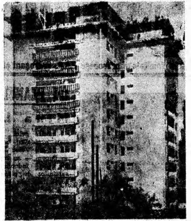
Bloc turn în lucru.

Lupeni, orașul cu vechi tradiții minierești, cunoaște în fiecare an schimbări înnoitoare în adăncuri și la suprafață. Construcția de locuințe și edificii social-culturale a luat o amploare deosebită. Necesitatea reducerii termenilor de execuție i-a determinat pe constructori să caute mereu căi noi pentru accelerarea ritmului de execuție pe fiecare bloc. Împărtășind experiența altor șantiere în domeniul construcției de blocuri, aducând îmbunătățiri metodelor cunoscute, constructorii Lupeniului au înnoțit cu succes una din metodele de lucru absolut noi în Valea Jiului: executarea blocului D 1 cu 66 de apartamente și 11 nivele după o tehnologie complexă în care o dată cu glisarea blocului se execută finisajele exterioare, turnarea planșelor, a rampelor de scări și balcoanelor, creând front larg de lucru la finisajele interioare. Timpul de execuție a blocului D 1 după această tehnologie complexă se va reduce cu circa 2 luni de zile. În pagina de față vom împărtăși cititorilor noștri experiența constructorilor din Lupeni în aplicarea metodelor noi de lucru.