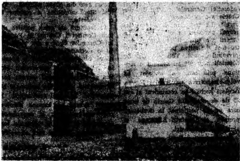
Vedere parțială a uzinei de metale și aliaje neferoase din București.

„În vizita mea prin modernul uzină de metale și aliaje neferoase am făcut cunoștință și cu citiva din cei care au contribuit la făurirea acestei