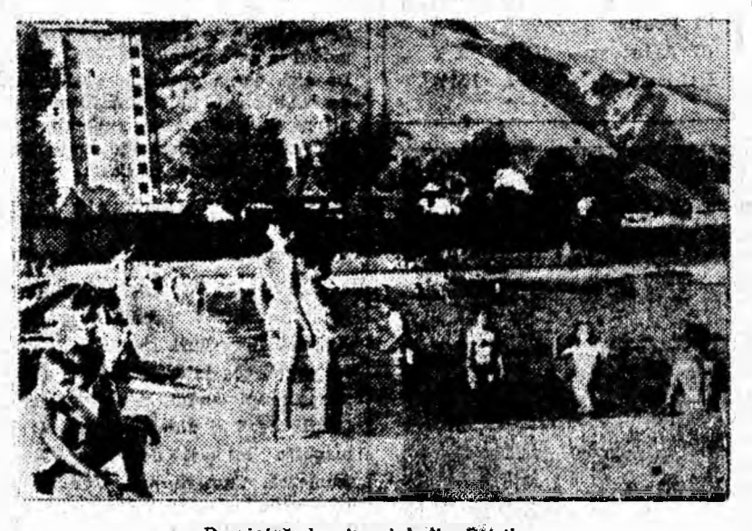
Duminică, la strandul din Petrița.

Duminică, 1 august, echipele de copii, reprezentative ale asociațiilor sportive și ale localităților, au început tradiționala întrecere pentru desemnarea echipei campioane la fotbal pe Valea Jiului în noua ediție a campionatului orașenesc 1965/66.