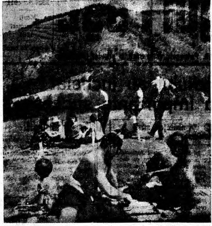
Cabanele din Valea Jiului au cunoscut duminică din nou o mare afliuență de excursioniști. Iată-i pe cîțiva din aceștia pe platoul din apropierea cabanei Rusu.