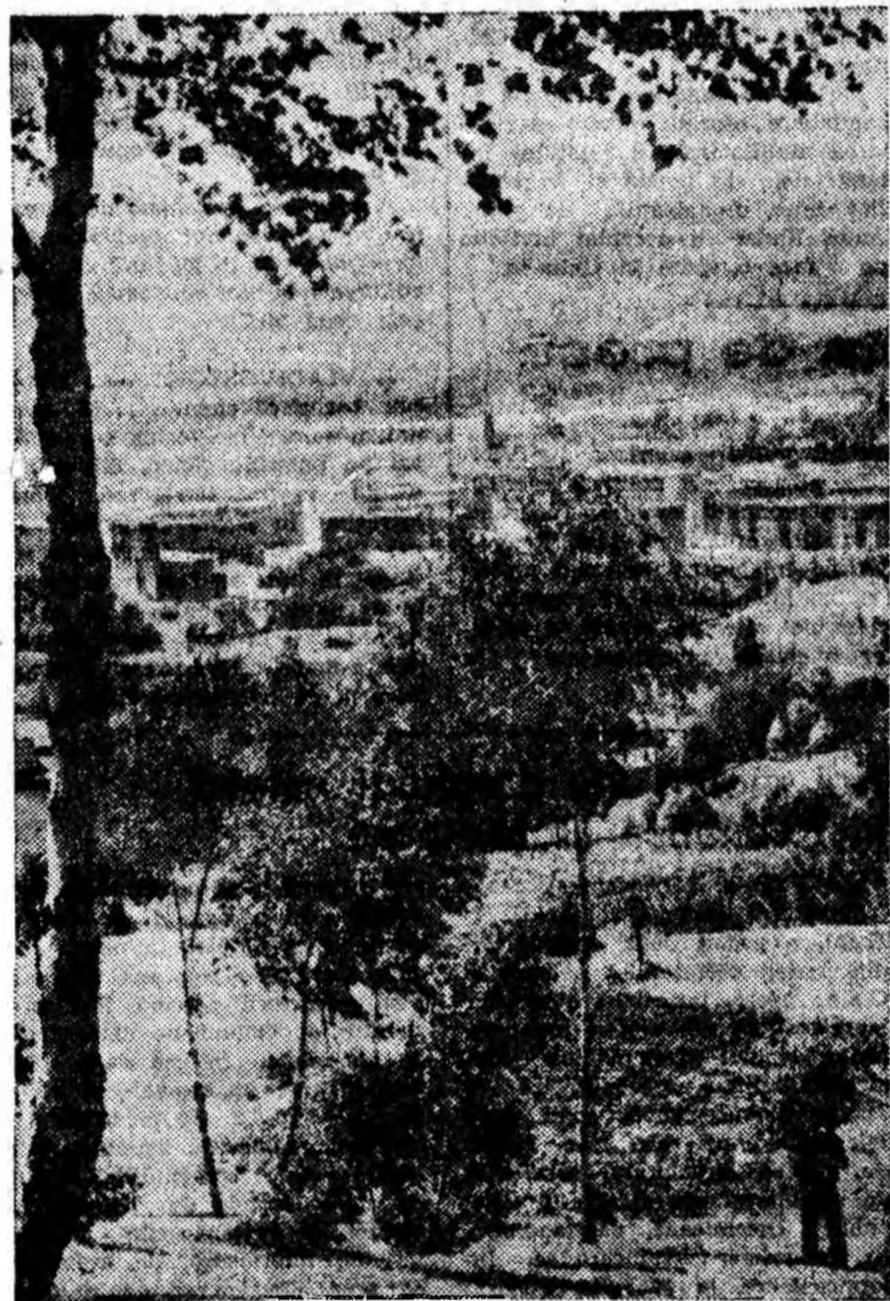
Livezeni — cel mai tînăr cartier al orașului Petroșani — pare și mai frumos cînd e privit printru draperiile de verdeață ale mestecenilor de pe dealul din apropiere.

de fier și beton peste ape și prăpăstii deschizînd cale nouă circulației între țărîmuri și așezări merrilă stîmă și recunoștința noastră, a celor care pășim peste poduri. Lucrînd în condiții grele, transpirînd în viață culezanța gîndirii științifice ingineresti, podarii muncesc cu maximă conștiință pentru ca lucrările ce le execută să aibă maximum de siguranță.