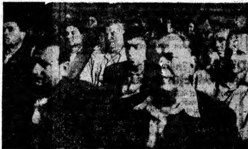
Aspect din timpul lucrărilor sesiunii.

Un rol important în buna organizare a șantierelelor îl au organizațiile de partid. Ele trebuie să militeze pentru întărirea disciplinei, ridicarea nivelului de cunoștințe profesionale ale muncitorilor, pentru aplicarea pe scară largă a noului, pentru combaterea risipei de materiale. Toate forțele și posibilitățile existente în prezent pe șantiere trebuie să fie mobilizate și folosite la maximum în vederea realizării apartamentelor planificate, la timp, de o calitate superioară și la un preț de cost cît mai redus.