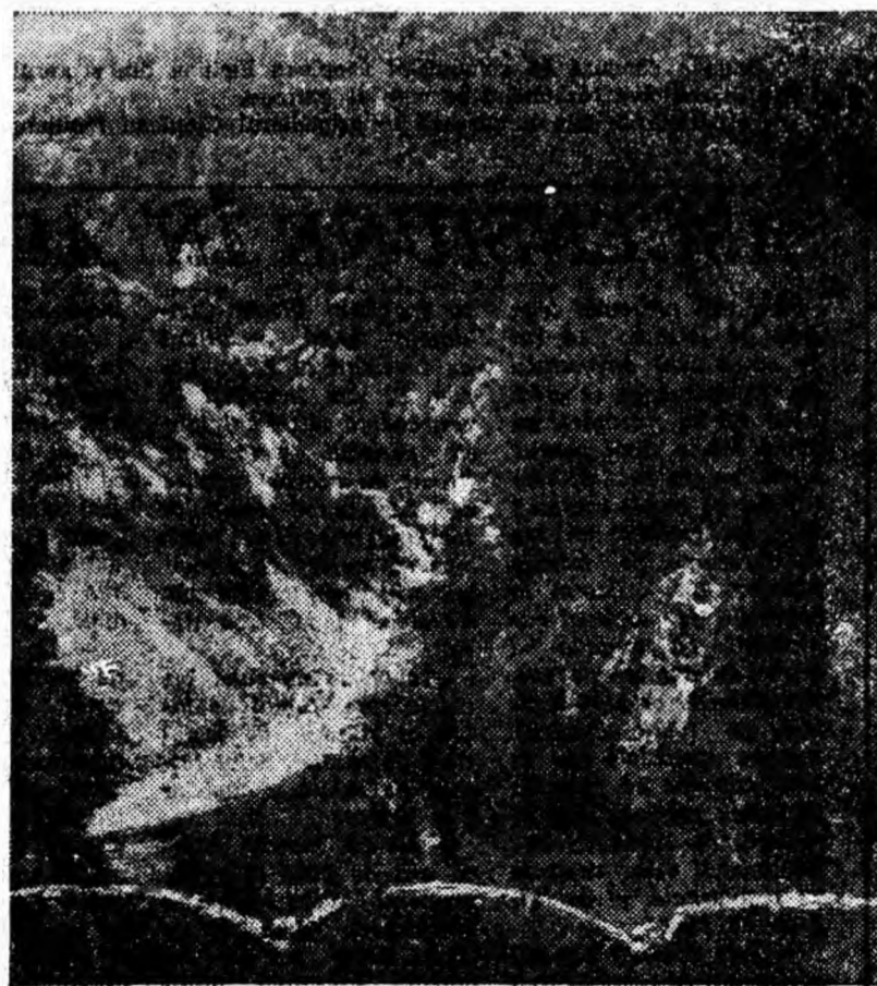
Locuri atractive de pe DEFILUL JULUI!