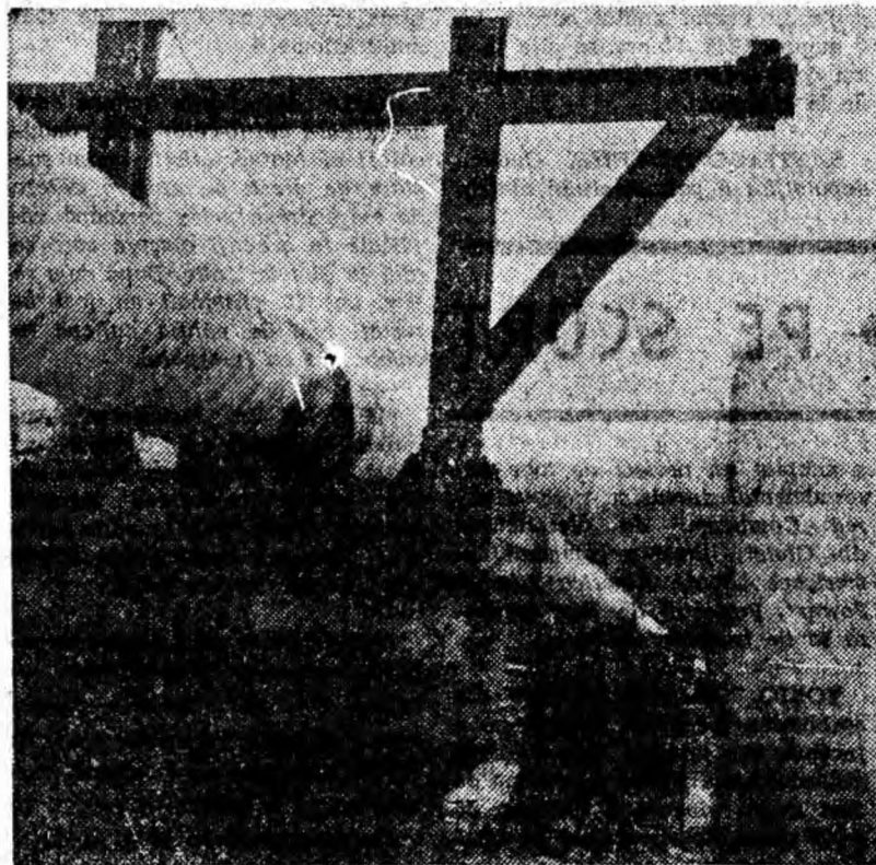
Puternice artere de alimentare cu gaze naturale a termocentralei Petroșani.

PETROȘANI — 7 NOIEMBRIE. Pensunea Boulanka. REPUBLICA: Două etaje de ferestre; LONEA: Hankă; ISCRONI: Incurcătură blestemată; ANINOABA: Sochestratul din Altona; VULCAN: Comisarul Matret se infurie; PAROȘANI: Elena din Troia; BĂRBĂTENI: Le strade; URICANI: Pata din casa roșie.