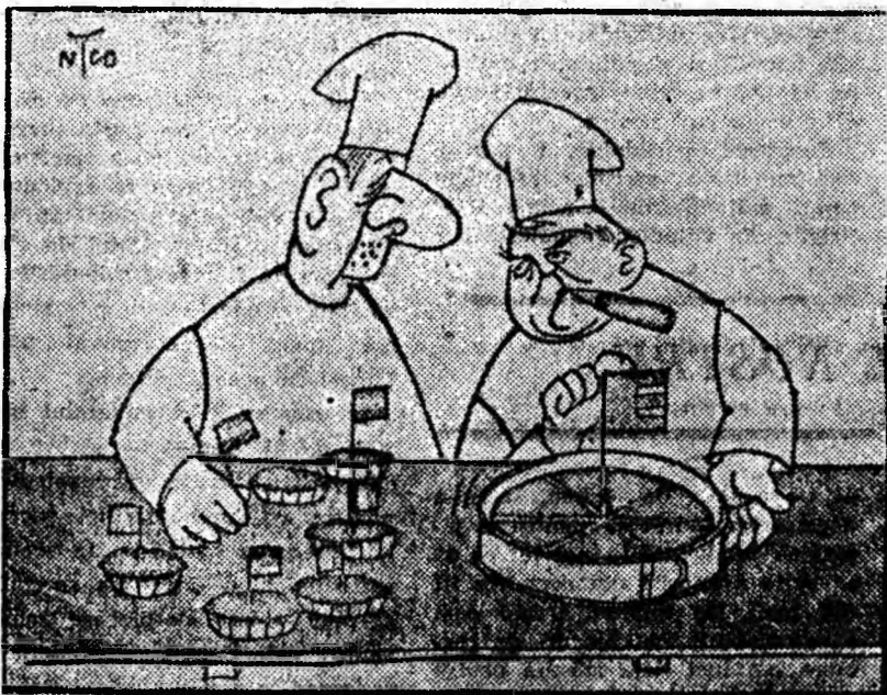
Divergențe în bucătăria Micii Europe.

— Nu e pentru mine. — De ce mă rog? — Păi, drumul meu de acasă pînă la piață este de 15 km, înseamnă că, dacă îți cumpăr calul ăsta, mai am de făcut 5 km pe jos.