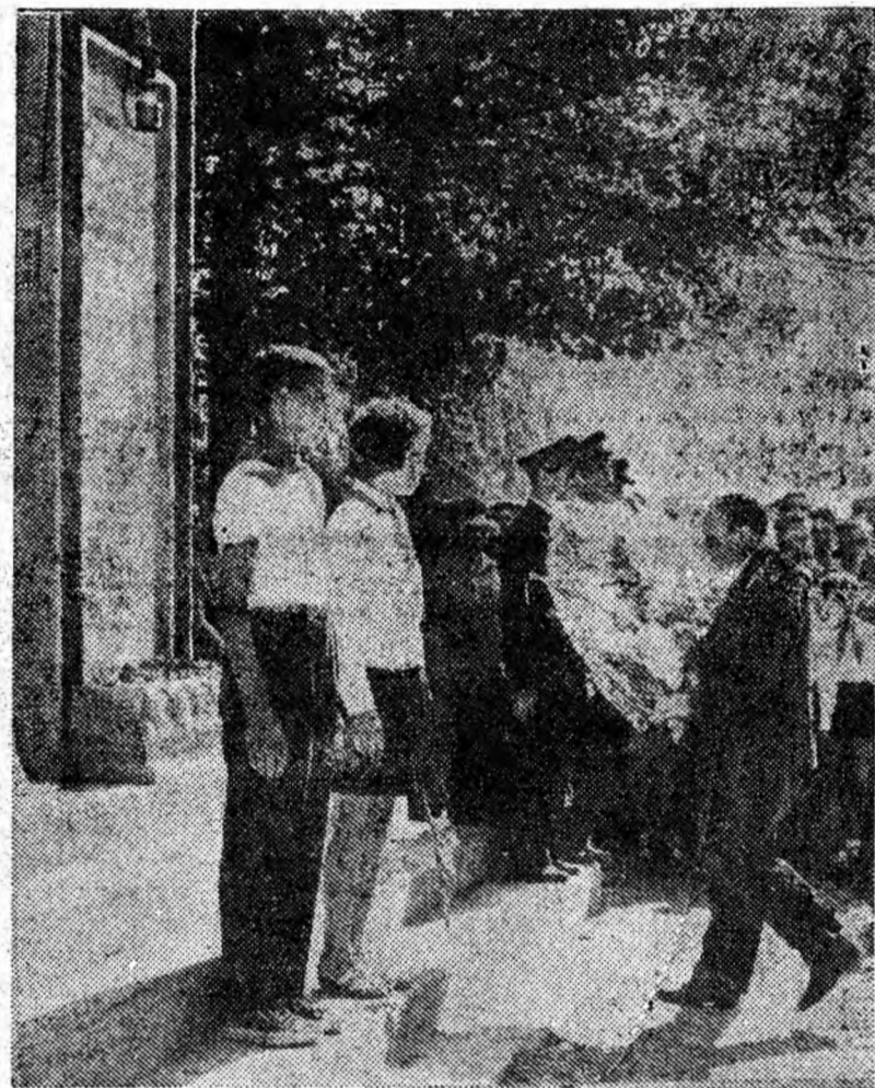
La placa comemorativă de la uzina electrică din incinta minei Lupeni. Se depun jerbe și buchete de flori.