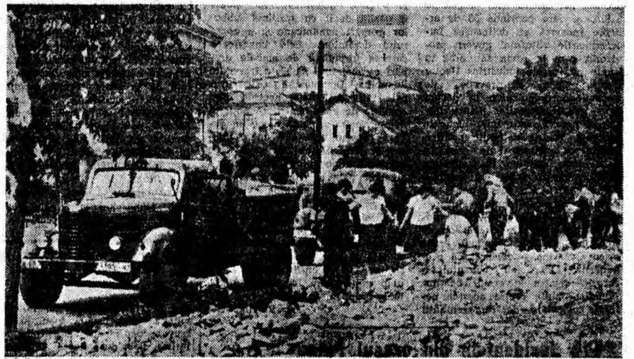
Cetățeni din Petroșani lucrînd la amenajarea terenului din fața sfetului popular.

Totodată, comitetul filialei anunță membrii pescari, să treacă imediat la efectuarea lucrărilor de amenajare a apelor de munte conform sarcinilor repartizate grupelor. Responsabilii de grupe vor mobiliza pescarii sportivi la acțiunile pentru executarea lucrărilor stabilite, pînă la 31 august curent.