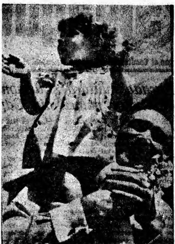
Tatăl și fiica demonștrăză fericții pentru viața nouă, mereu mai bogată și mai frumoasă în România Socialistă.