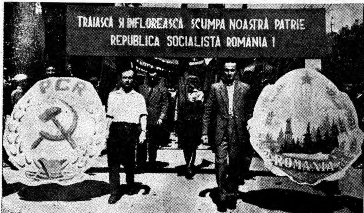
Pentru prima oară sînt purtate la demonstrație stemele Partidului Comunist Român și a Republicii Socialiste România.

E firesc deci ca pe fețele oamenilor din coloană să citești bucurie, entuziasm, hotărâre. Alături de întregul nostru popor, oamenii muncii din Valea Jiului au sărbătorit primul 23 August în republică socialistă.