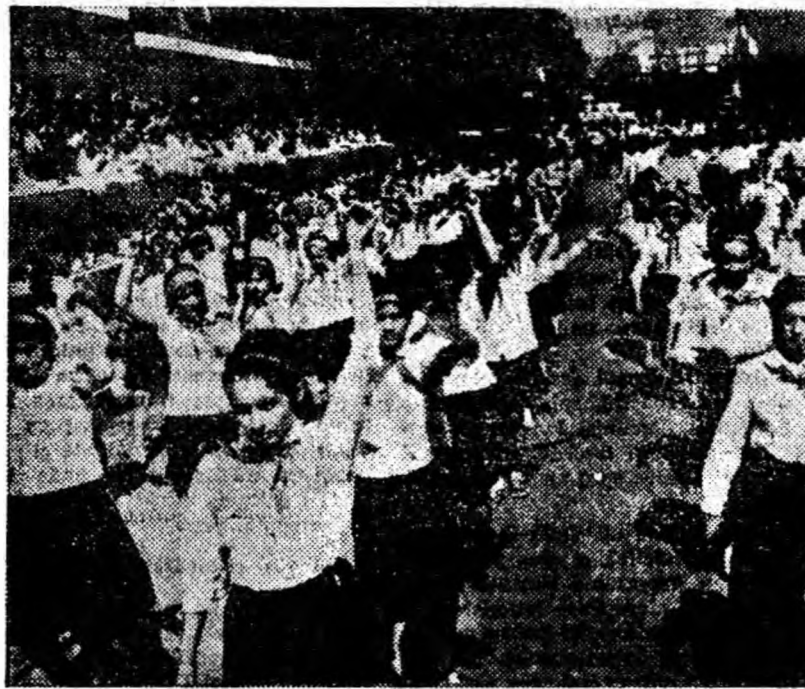
„Îți mulțumim, partid iubit pentru tinerețea fericită“, scandează elevii prin fața tribunei, fluturînd flori, batiste, eșarfe multicolore.

Sînt doar cîțiva dintre cei peste 20 000 elevi din Valea Jiului care învață în școlile generale de 8 ani, medii și profesionale, doar cîțiva din aceia care beneficiază de condiții minunate de viață și învățătură.