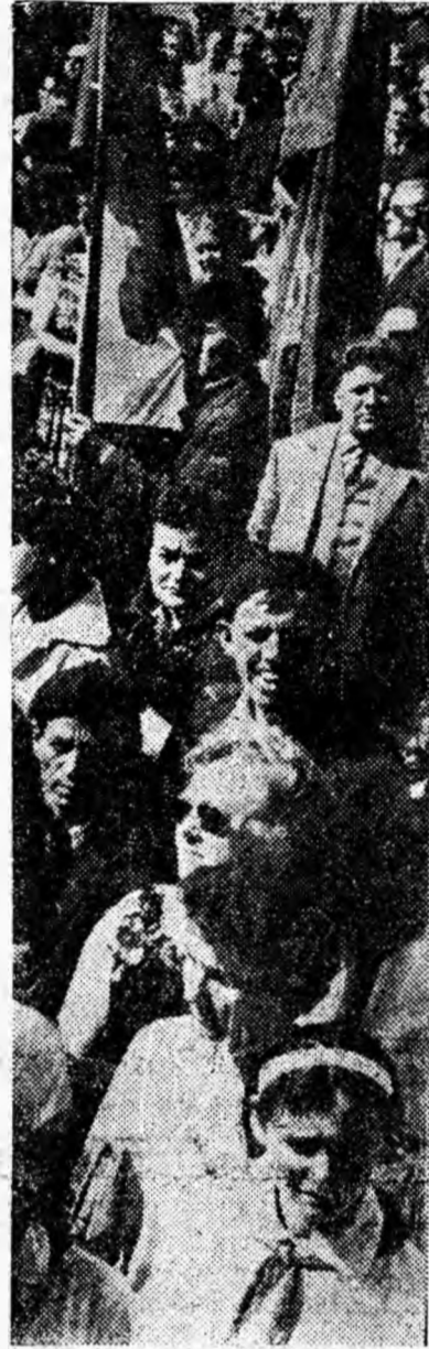
Înainte începerii mitingului în Piața Victoriei din orașul Petroșani.

Poporul nostru a sărbătorit cea de-a XXI-a aniversare a eliberării patriei de sub jugul fascist într-o atmosferă de puternic entuziasm, bucurie, optimism, hotărâre fermă de a îndeplini sarcinile trasate de partid.