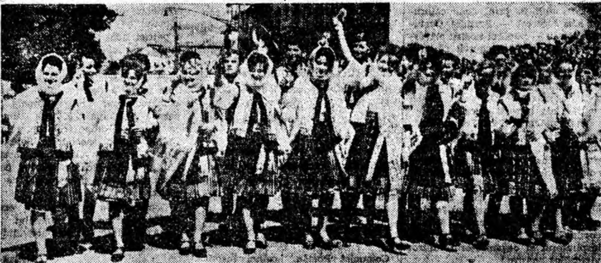
Cele douăsprezece perechi de dansatori ai clubului sindicatelor din Petroșani defilează umăr la umăr prin fața tribunei formînd o panglică multicoloră.

Au demonstrat cu bucurie artiștii amatori, aceia pentru care munca și scena au devenit pasiuni paralele, atribute caracteristice oamenilor din patria noastră, Republica Socialistă România.