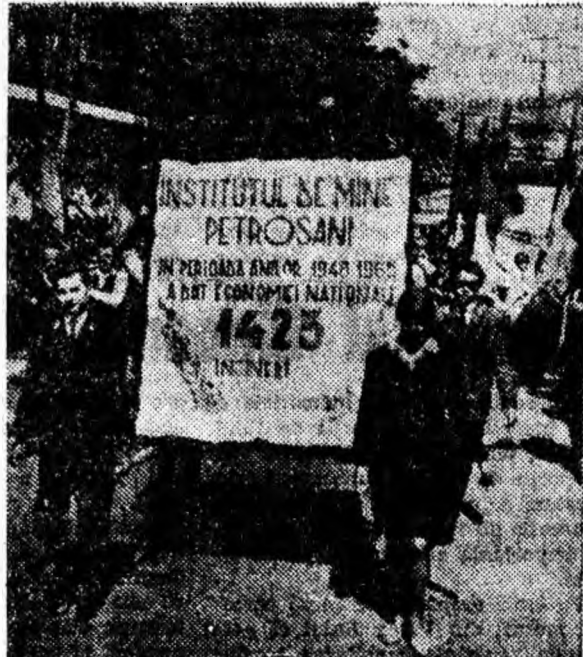
Coloana studenților și cadrelor didactice de la Institutul de mine Petroșani.

Purtînd drapele roșii și tricolore, avînd înscrise pe ele „Partidul Comunist Român” și „Republica Socialistă România”, fluturînd flori, eșarfe și baloane multicolore, studenții și cadrele didactice își manifestează entuziasmul, bucuria și recunoștința față de partid și guvern, pentru condițiile minunate de studiu și de viață.