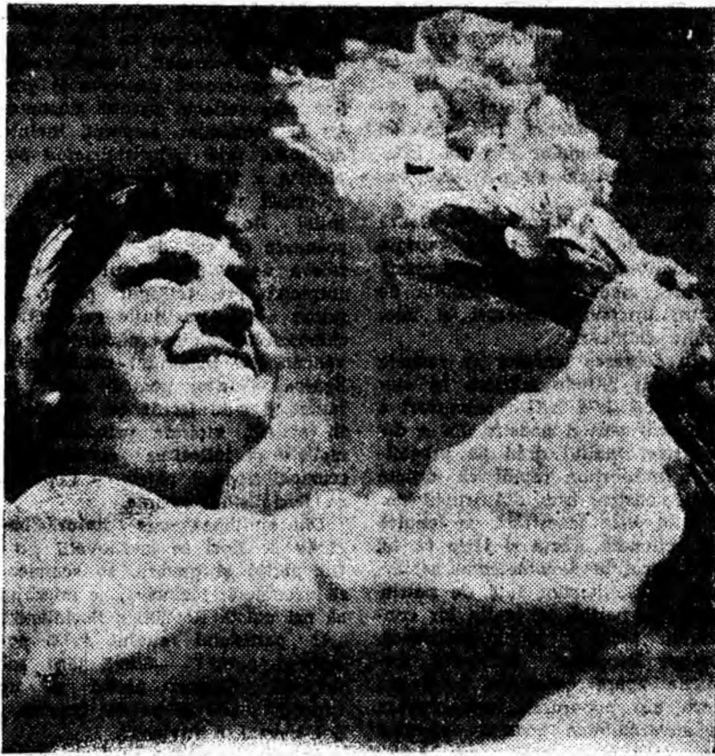
Zîmbet senin și flori dăruite marilor sărbători a lui August 23.