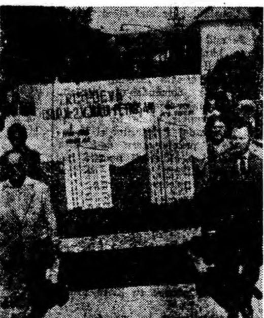
Graficul purtat de constructorii oglindește dinamica inoierii urbanistice a Văii noastre.