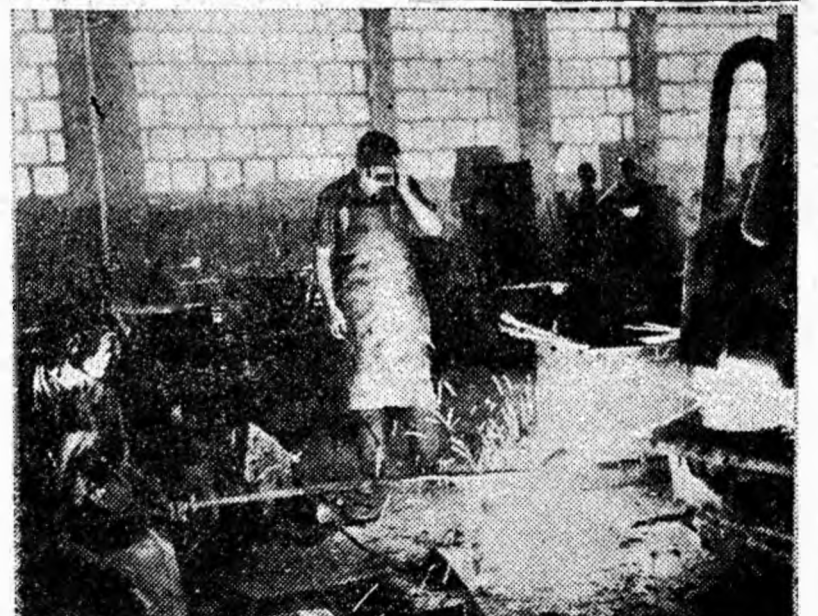
La turnătoria U.R.U.M.P. se elaborează o nouă „șarjă” de piese de schimb pentru utilajele miniere de la exploatarea din bazinul nostru carbifer.