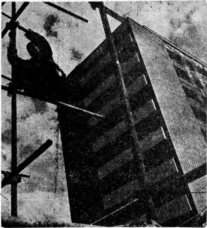
Blocul se înalță mindru din păienjeniișul schelelor.