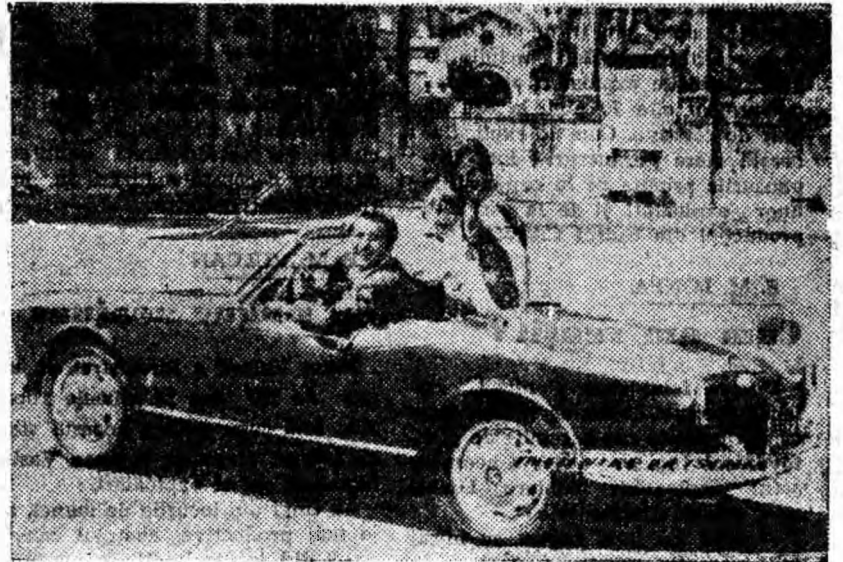
IN CLISEU: O secvență din film.

Filmul va rula la cinematograful Republica.