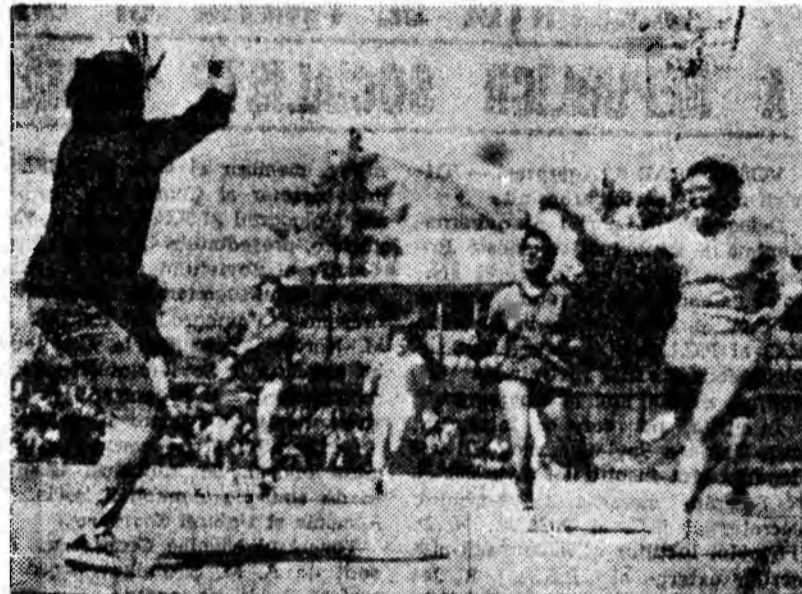
Atac la poarta gazdelor.