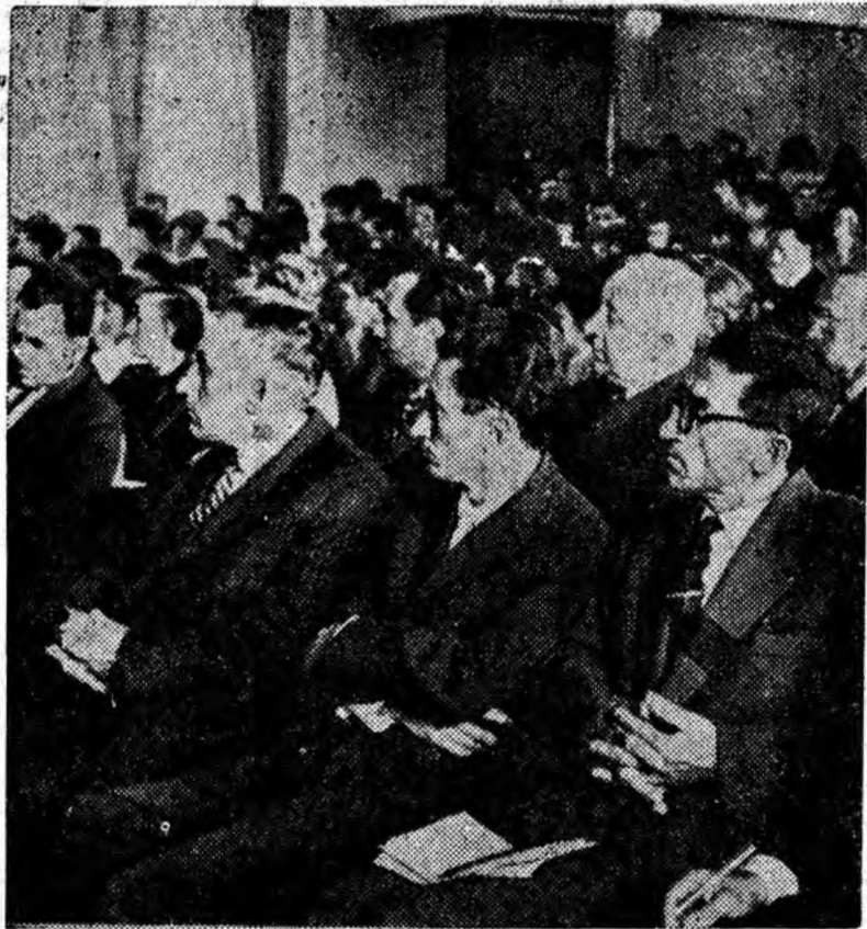
Aspect de la constăturile cadrelor didactice.