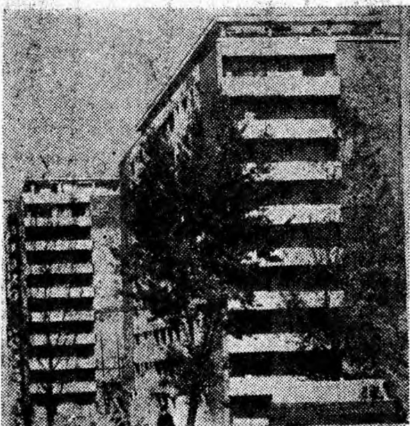
Siluate fermecătoare în ambianța lor — blocuri și pomi — alcătuiesc peisajul Vulcanului înnoit.