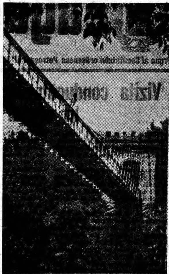
Parcul poporului din orașul Craiova.